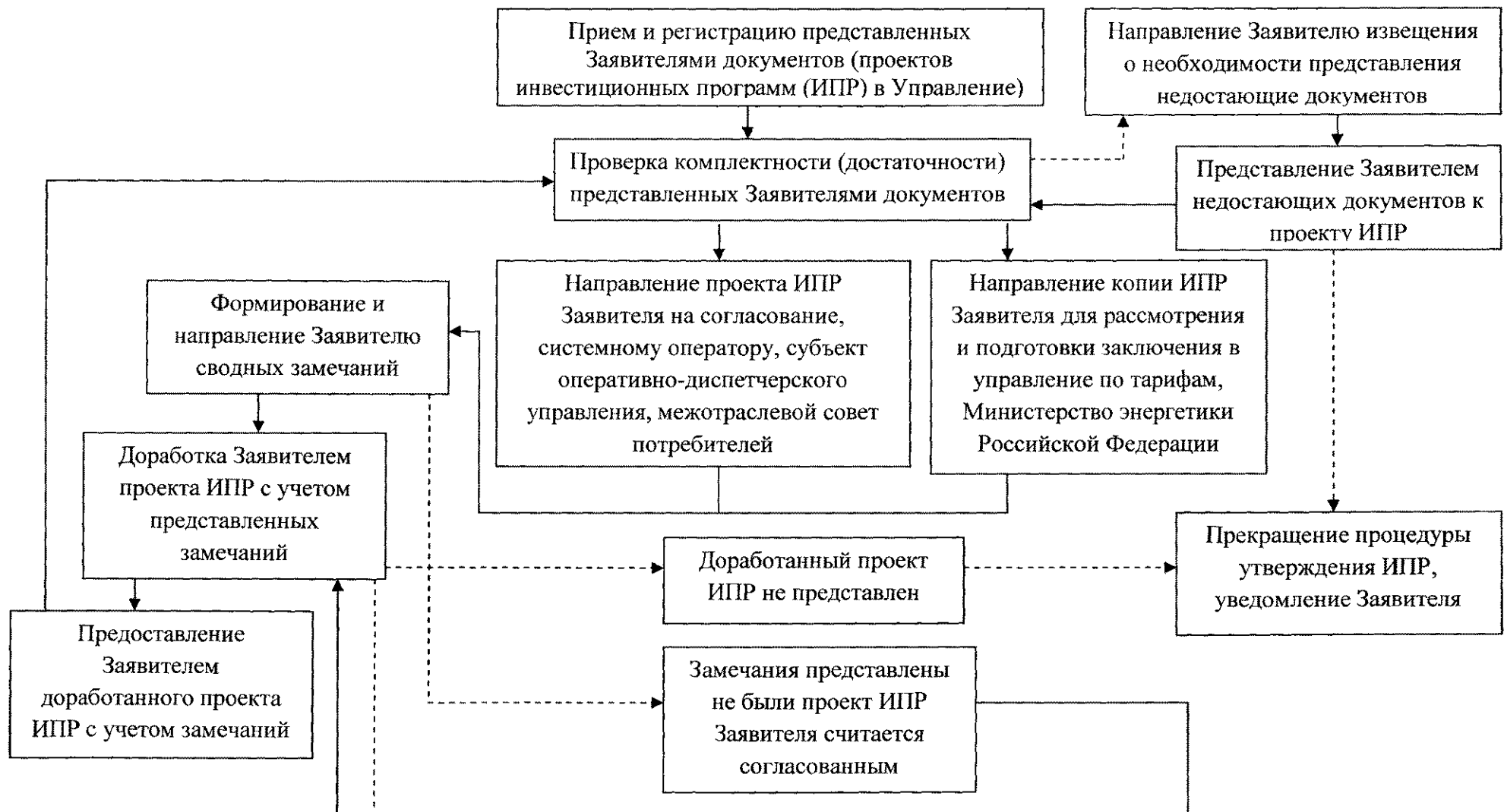
Блок-схема последовательности административных процедур при предоставлении государственной услуги