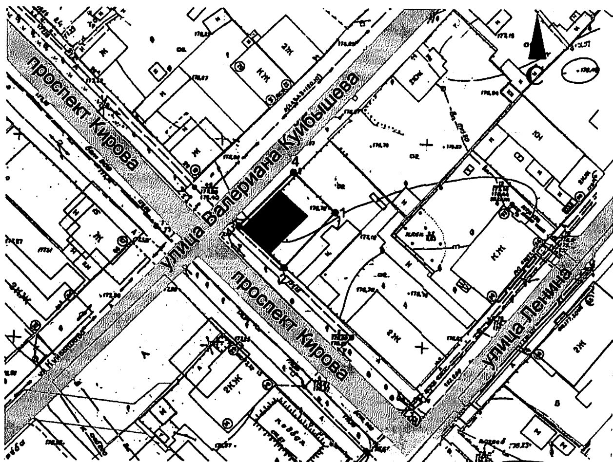
КАРТА (СХЕМА) границ территории объекта культурного наследия

В целях обеспечения сохранности объекта культурного наследия регионального значения «Жилой дом», 1902 г., расположенного по адресу: Алтайский край, г. Бийск, пр-кт Кирова, 20 (далее – «объект культурного наследия»), устанавливается следующая территория.