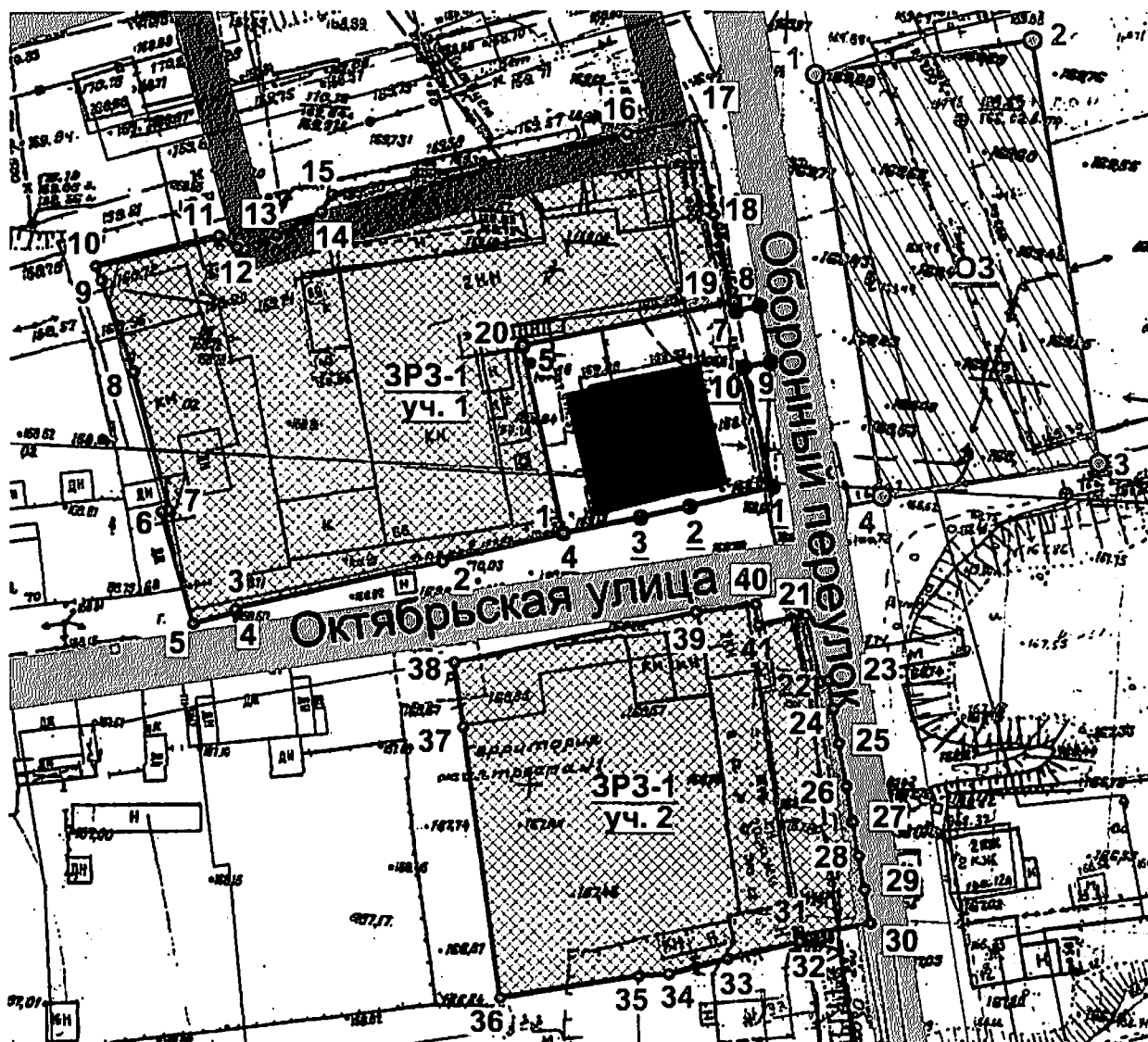
КАРТА (СХЕМА) границ зон охраны объекта культурного наследия регионального значения «Жилой дом», 1910 г., расположенного по адресу: Алтайский край, г. Бийск, ул. Октябрьская, 66

УТВЕРЖДЕНА приказом управления государственной охраны объектов культурного наследия Алтайского края от 17.11.2020 № 1113