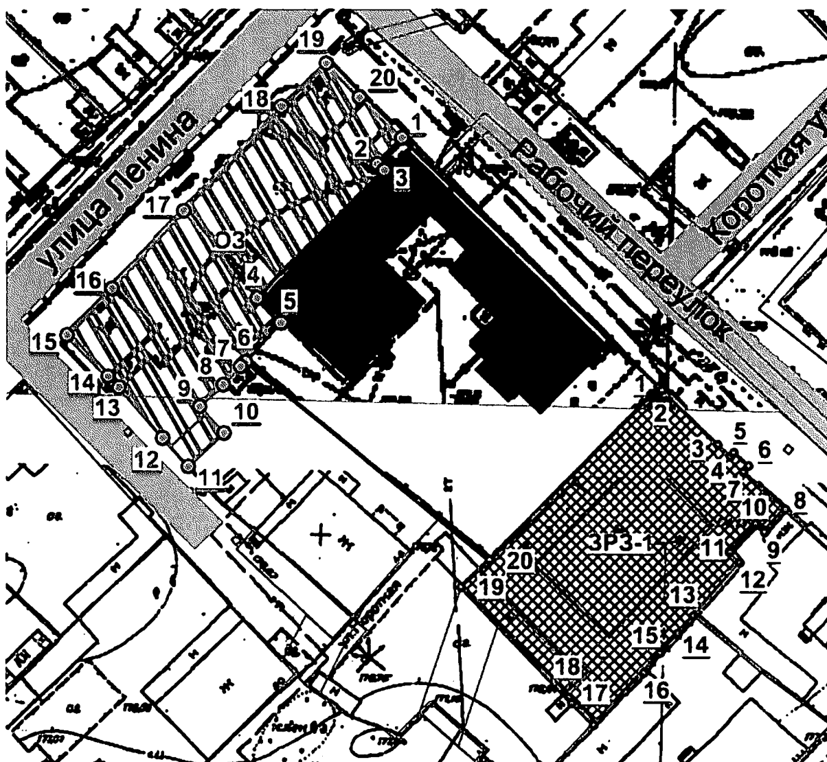
КАРТА (СХЕМА) границ зон охраны объекта культурного наследия регионального значения «Обособняк Кричевцева», 1889 г., расположенного по адресу: Алтайский край, г. Бийск, ул. Короткая, 46

УТВЕРЖДЕНА приказом управления государственной охраны объектов культурного наследия Алтайского края от 23.11.2020 № 1196