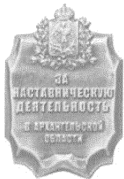
РИСУНОК знака отличия «За наставническую деятельность в Архангельской области»

УТВЕРЖДЕН указом Губернатора Архангельской области от 9 января 2020 г. № 1-у