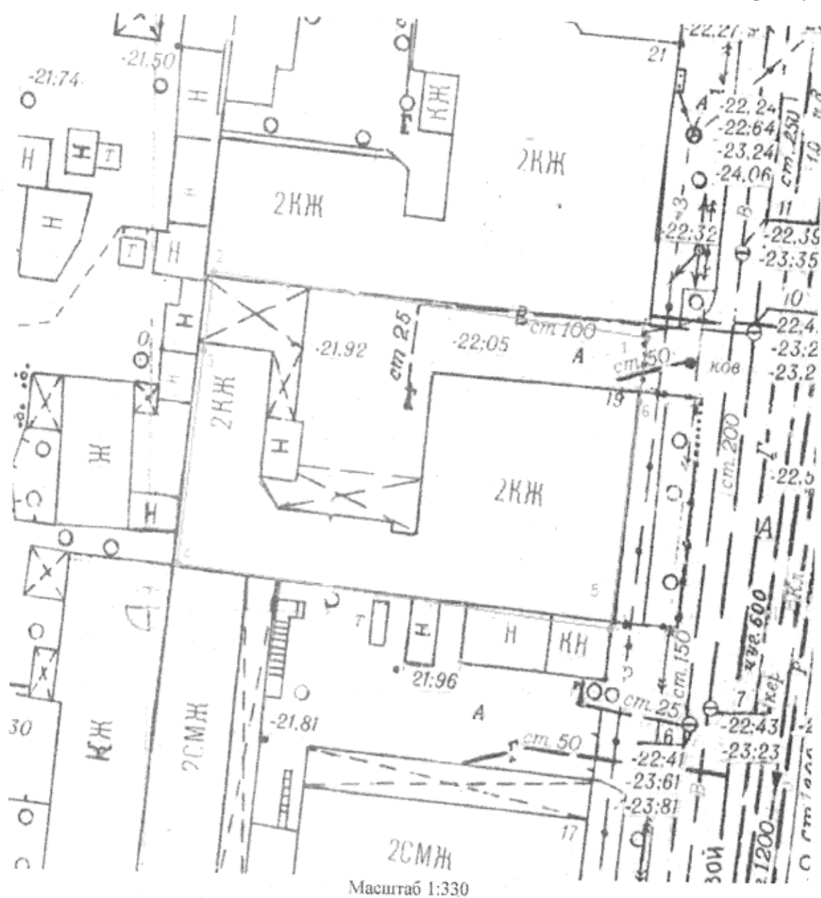
Схема границ территории объекта культурного наследия регионального значения «Дом жилой усадьбы Афанасова, 2-я пол. XIX в.», расположенного в городе Астрахани по адресу: ул. Максаковой, 19 (Лит. «А», ворота)

- изложить Приложение № 49 постановления в новой редакции: