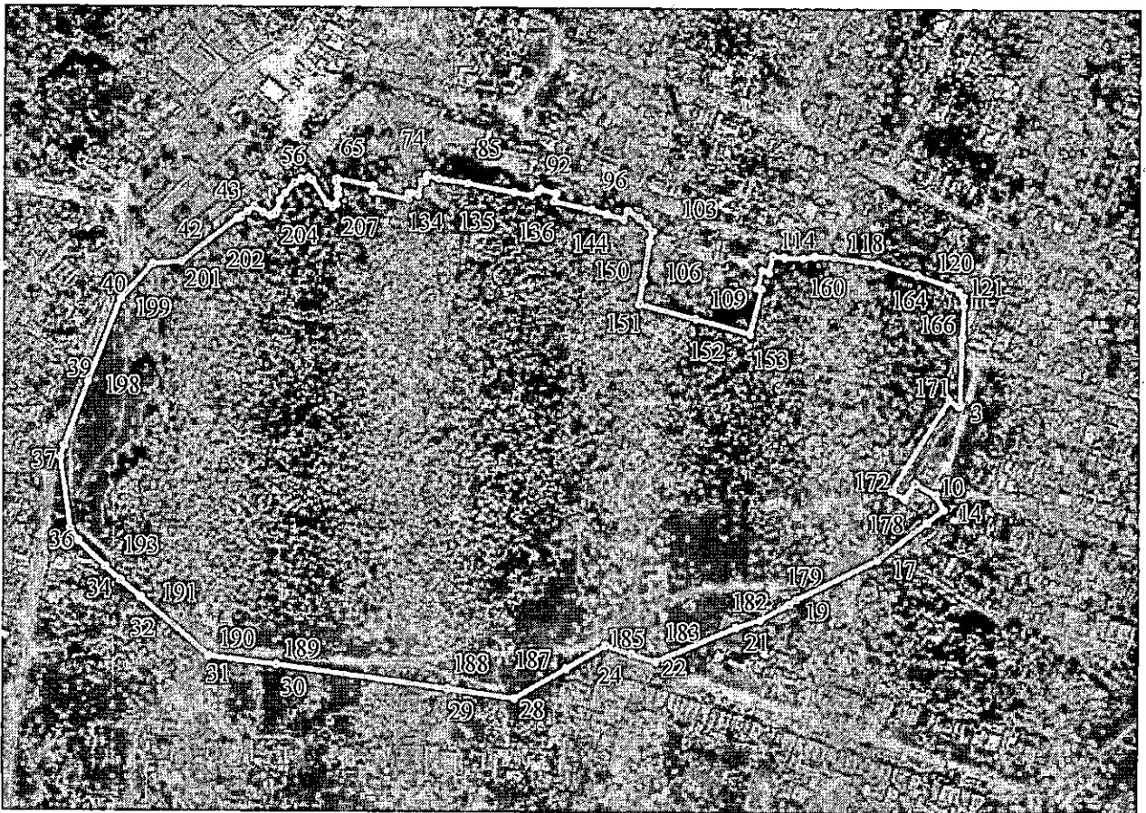
Карта-схема охранной зоны