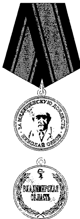
РИСУНОК МЕДАЛИ ОРЛОВА «ЗА МЕДИЦИНСКУЮ ДОБЛЕСТЬ»