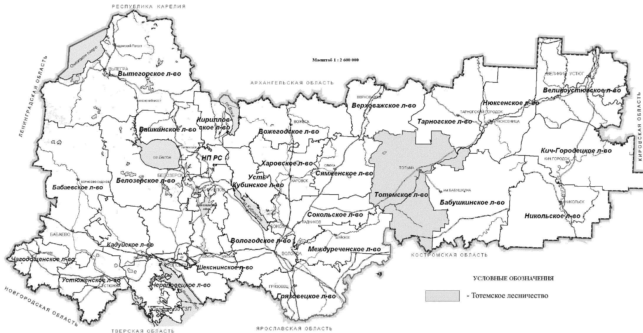
Карта-схема Вологодской области с выделением территории Тотемского лесничества