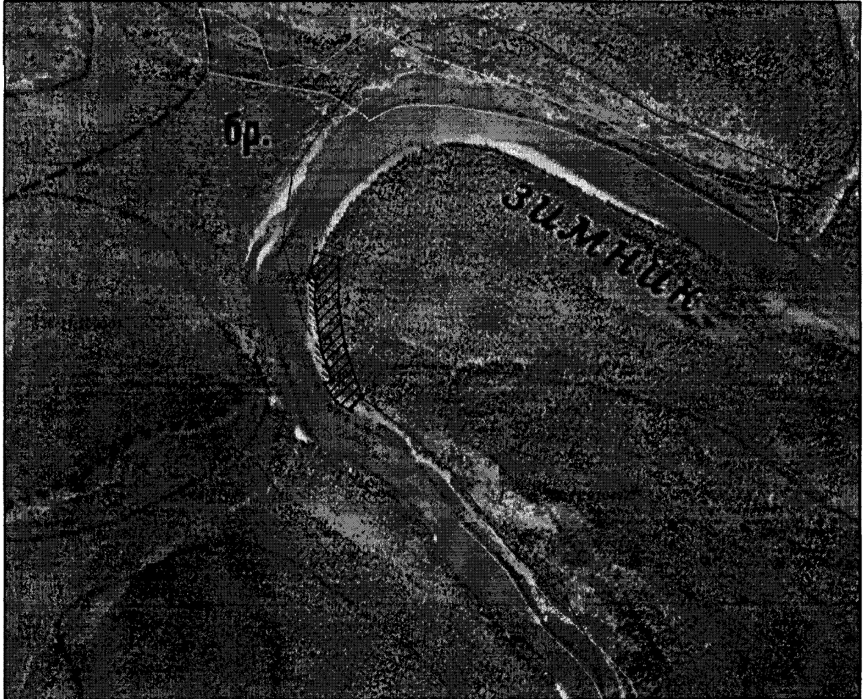
КАРТА-СХЕМА РАСПОЛОЖЕНИЯ ОХРАННОЙ ЗОНЫ памятника природы регионального значения "Писаница у Миллионного порога"