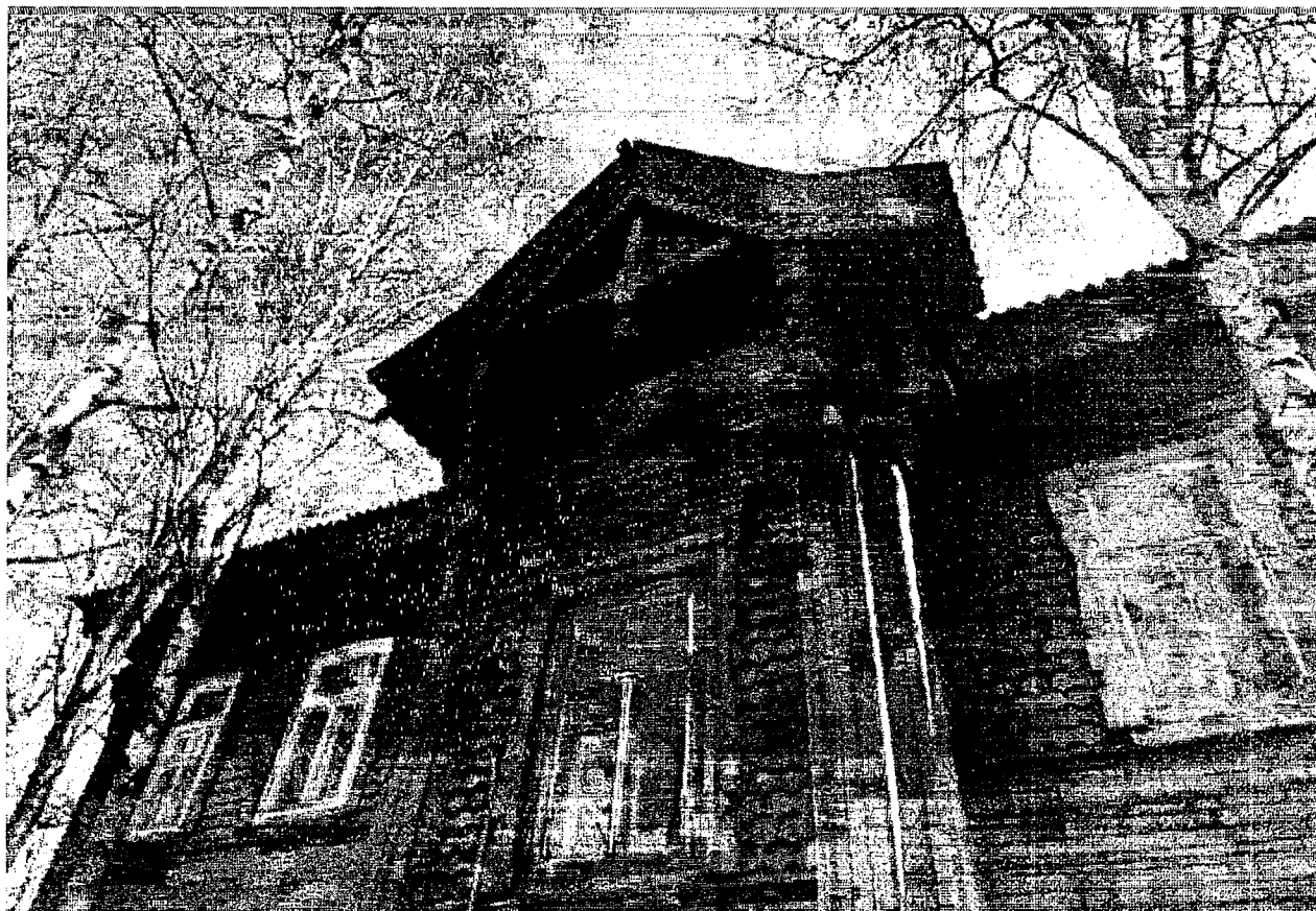
Оформление шипца входного ризалита