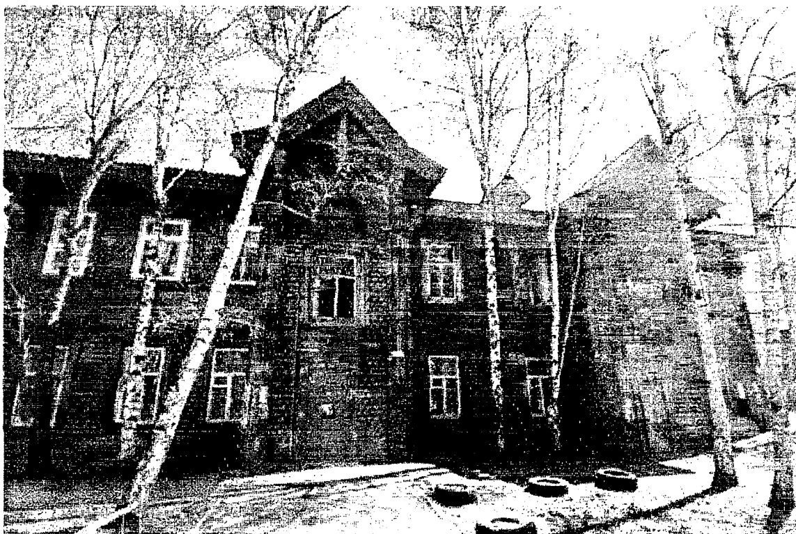
Фрагмент главного западного фасада