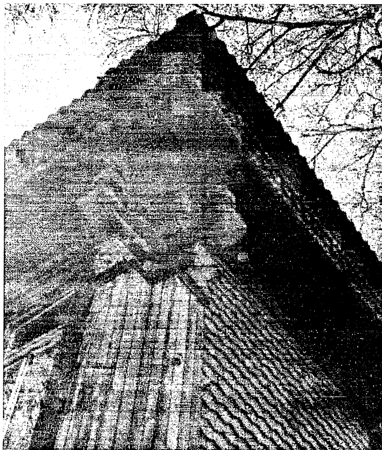
Стилизованные капители пилястр в нео-русском стиле