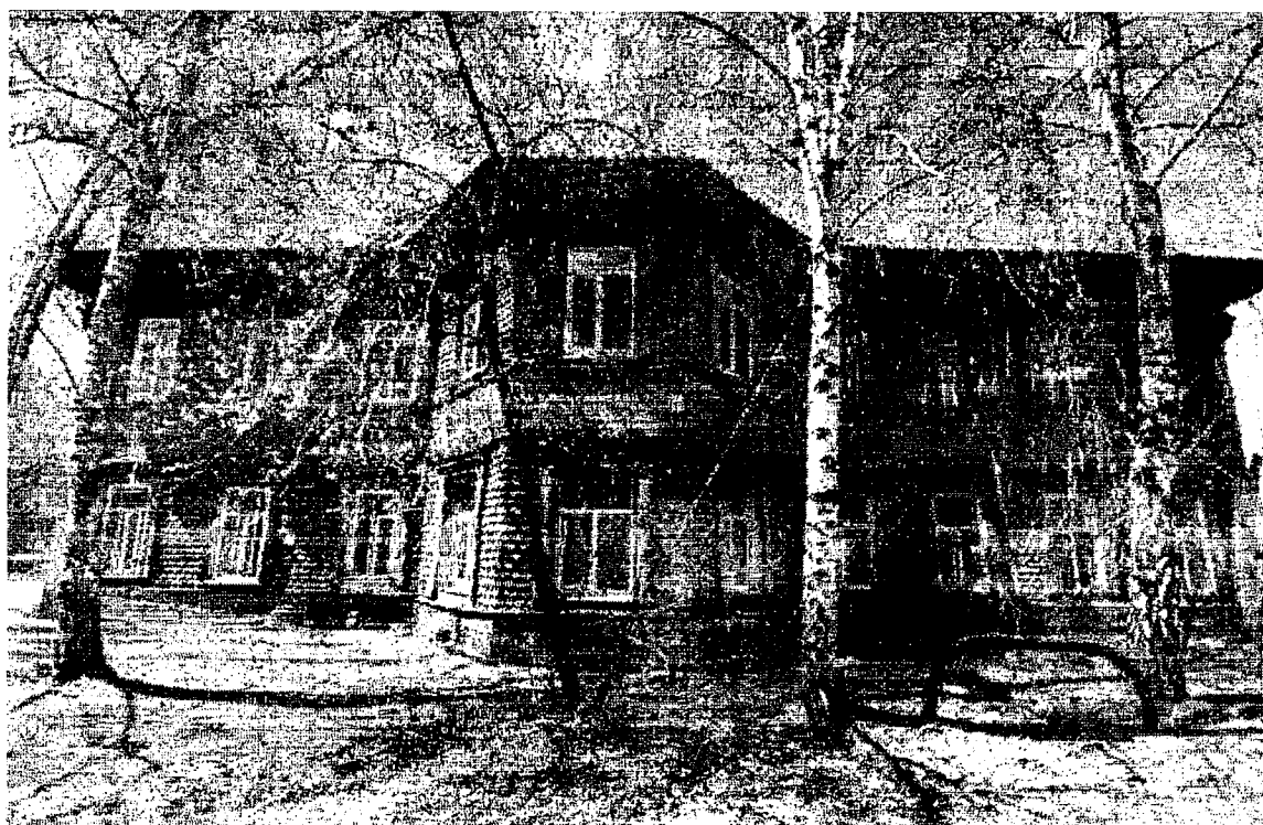
Продольный восточный фасад здания