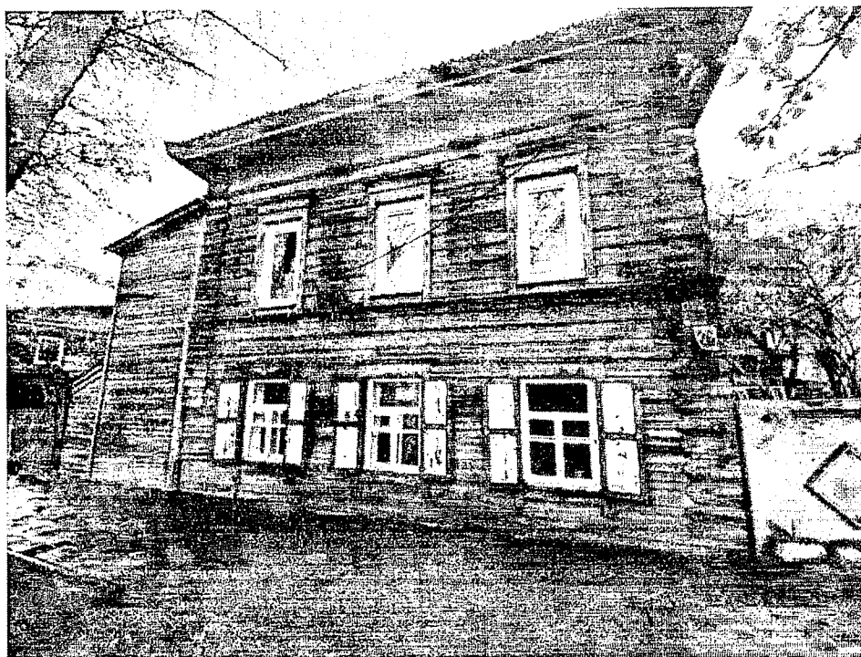
Главный северо-западный фасад.