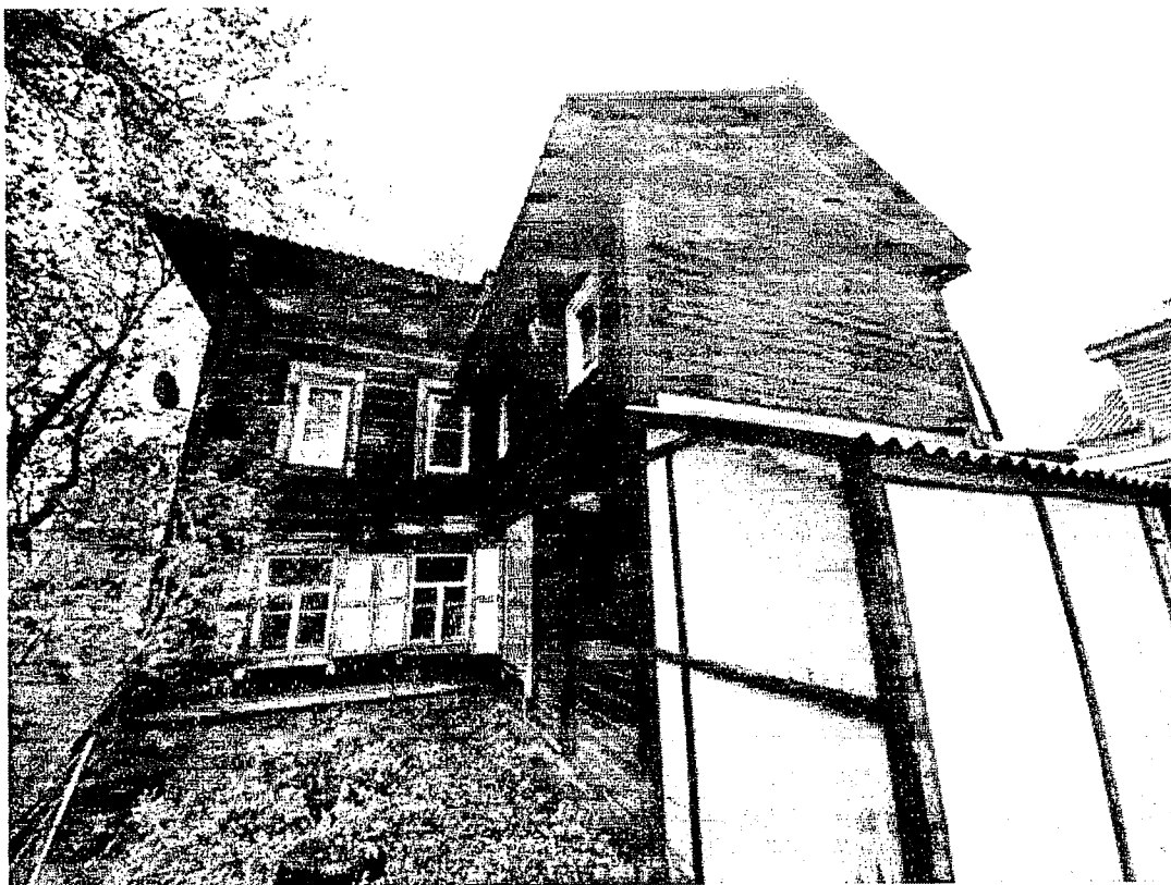
Вид на здание со стороны двора.