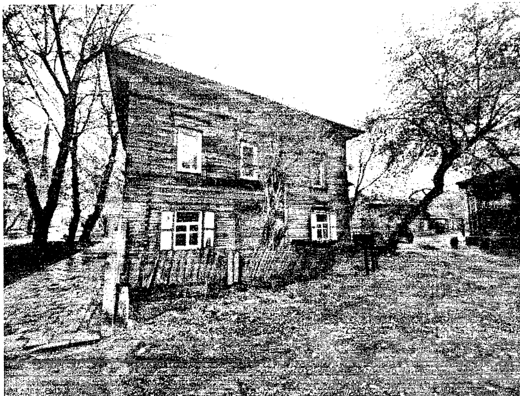
Боковой юго-западный фасад.