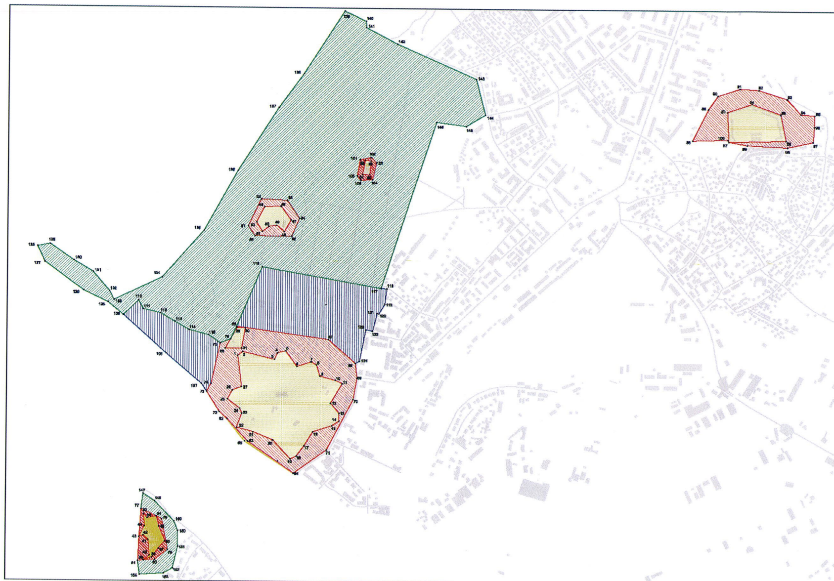
СХЕМА № 74

КООРДИНАТЫ ГРАНИЦ ЗОН ОХРАНЫ ОБЪЕКТА КУЛЬТУРНОГО НАСЛЕДИЯ РЕГИОНАЛЬНОГО ЗНАЧЕНИЯ