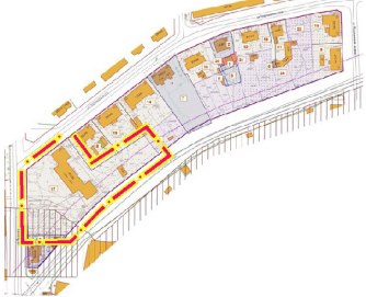
Схема расположения границ территории межевания границ ранее утвержденного проекта межевания территории

Изм. Кол. Лист Подп. Дата Разраб. Директор Селюткина Н.С. 06.24 Нач.отдела Подкова Л.П. 06.24 Инженер Цыпленкова И.В. 06.24