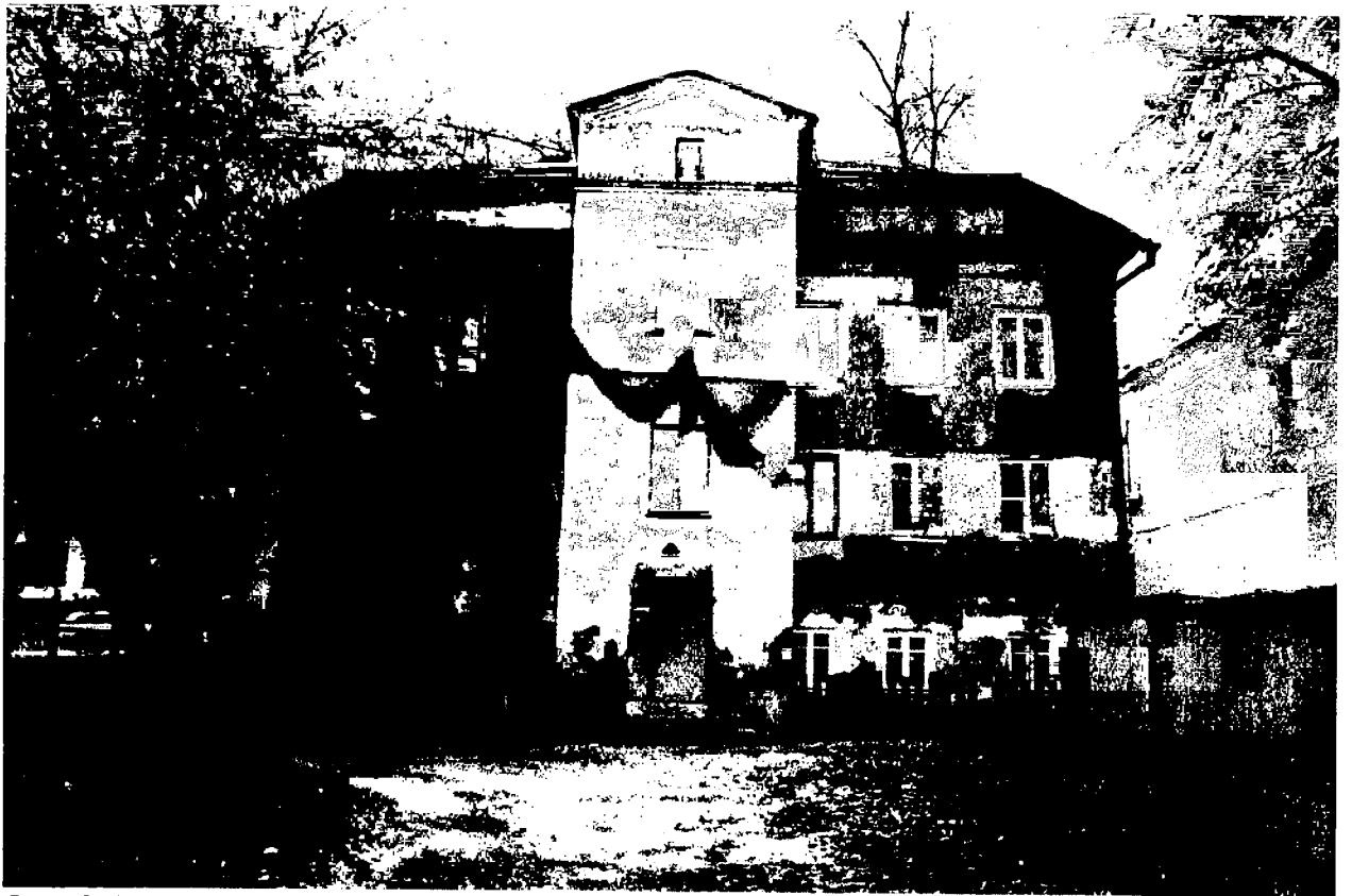
Фото 8. Дворовый (юго-восточный) фасад.