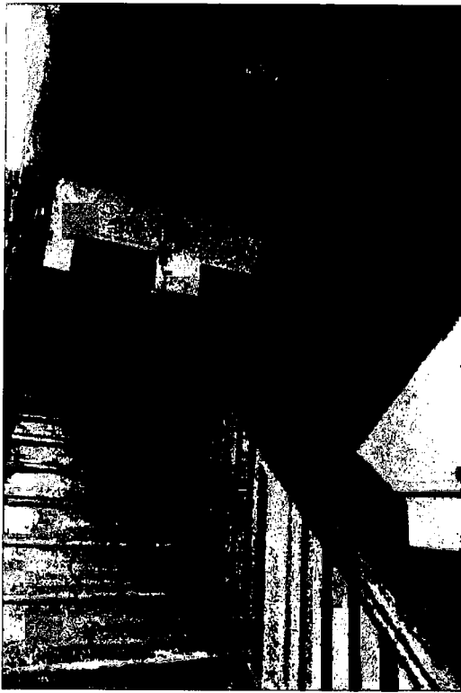
Фото 13. Интерьер лестничной клетки. Вид при входе.