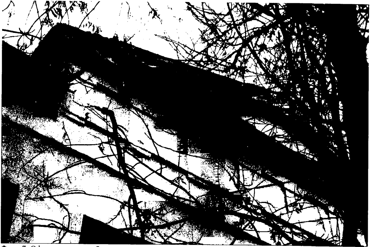
Фото 7. Оформление антаблемента ризалита.