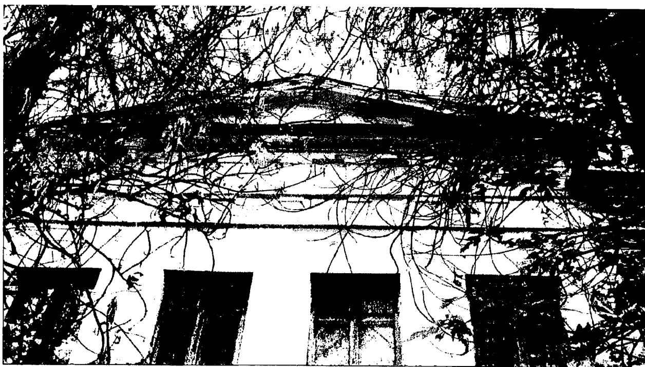
Фото 6. Антаблемент ризалита.