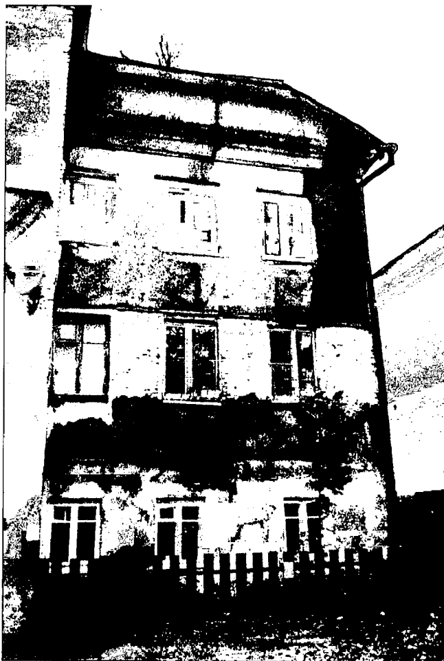
Фото 9. Правая часть дворового фасада.