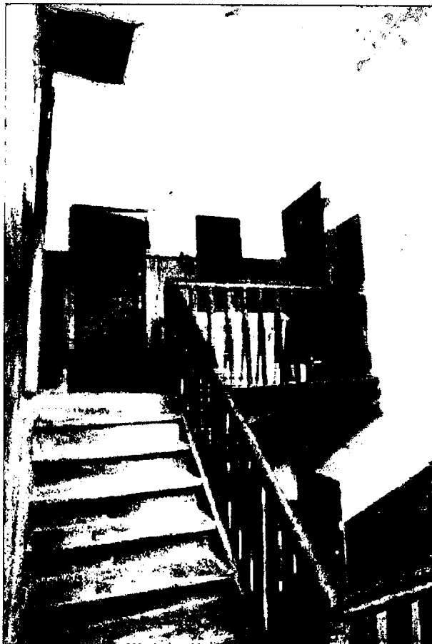
Фото 13. Лестничная клетка. Верхняя часть.