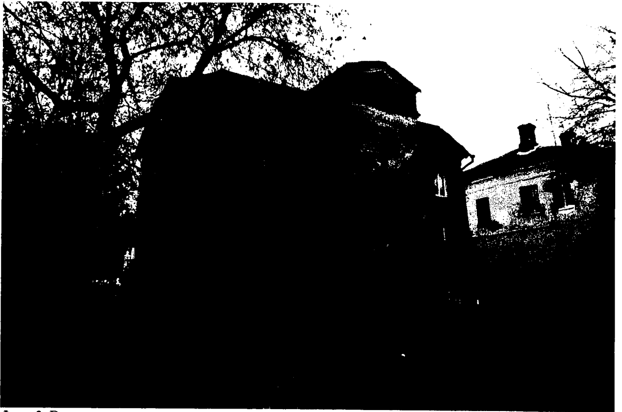
Фото 3. Вид с юга, со двора.