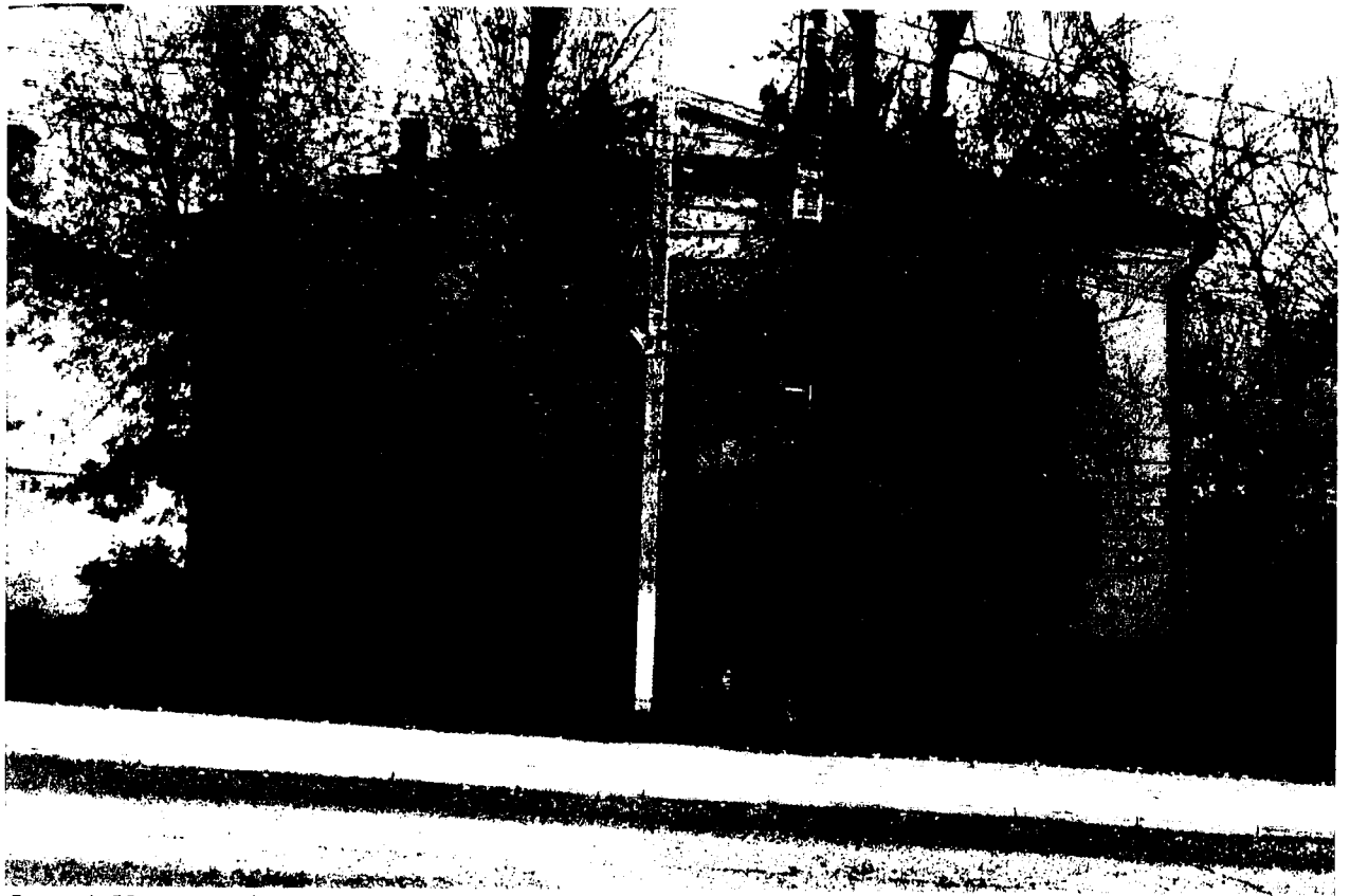
Фото 4. Уличный (северо-западный) фасад.