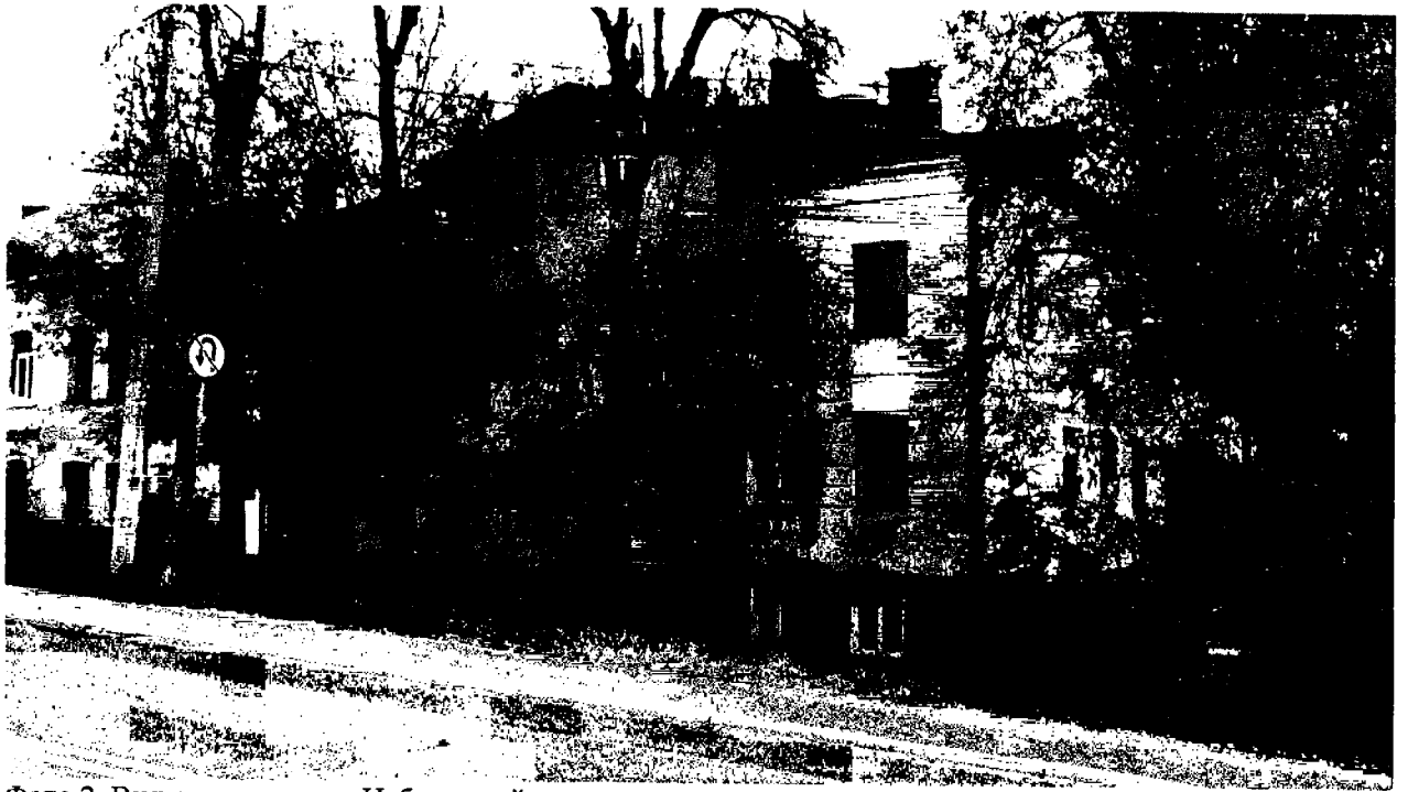
Фото 2. Вид с запада, с ул. Набережной.