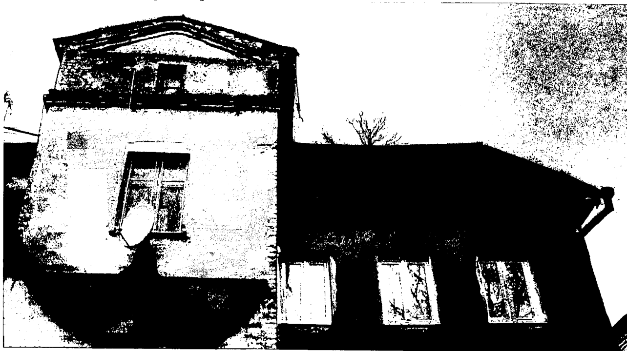
Фото 10. Дворовый фасад. Завершения стен основного объема и лестничной клетки.