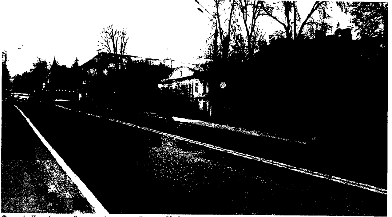
Фото 1. Дом (первый справа) в застройке ул. Набережной.