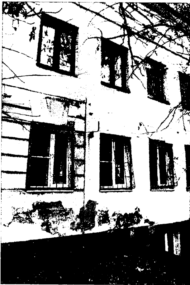
Фото 5. Ризалит, рустовка боковой части фасада, вешерные замки над нижними окнами.