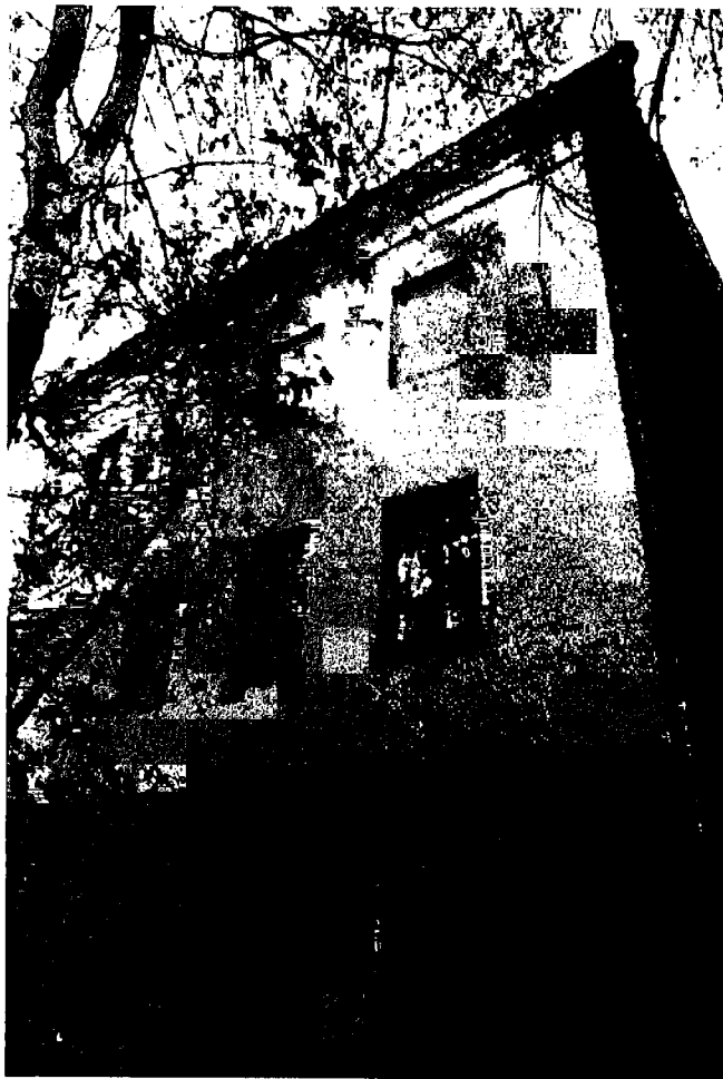
Фото 12. Юго-западный фасад.