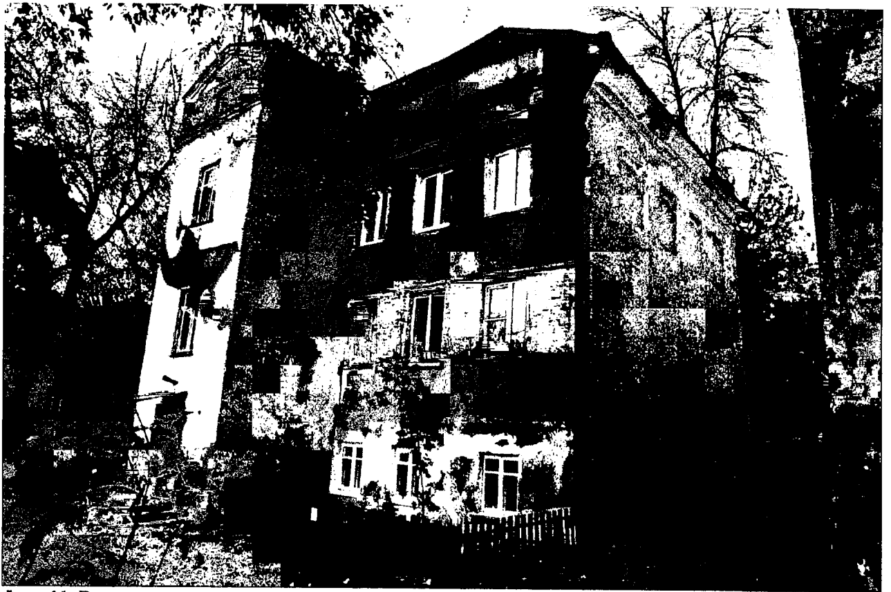
Фото 11. Вид с востока.