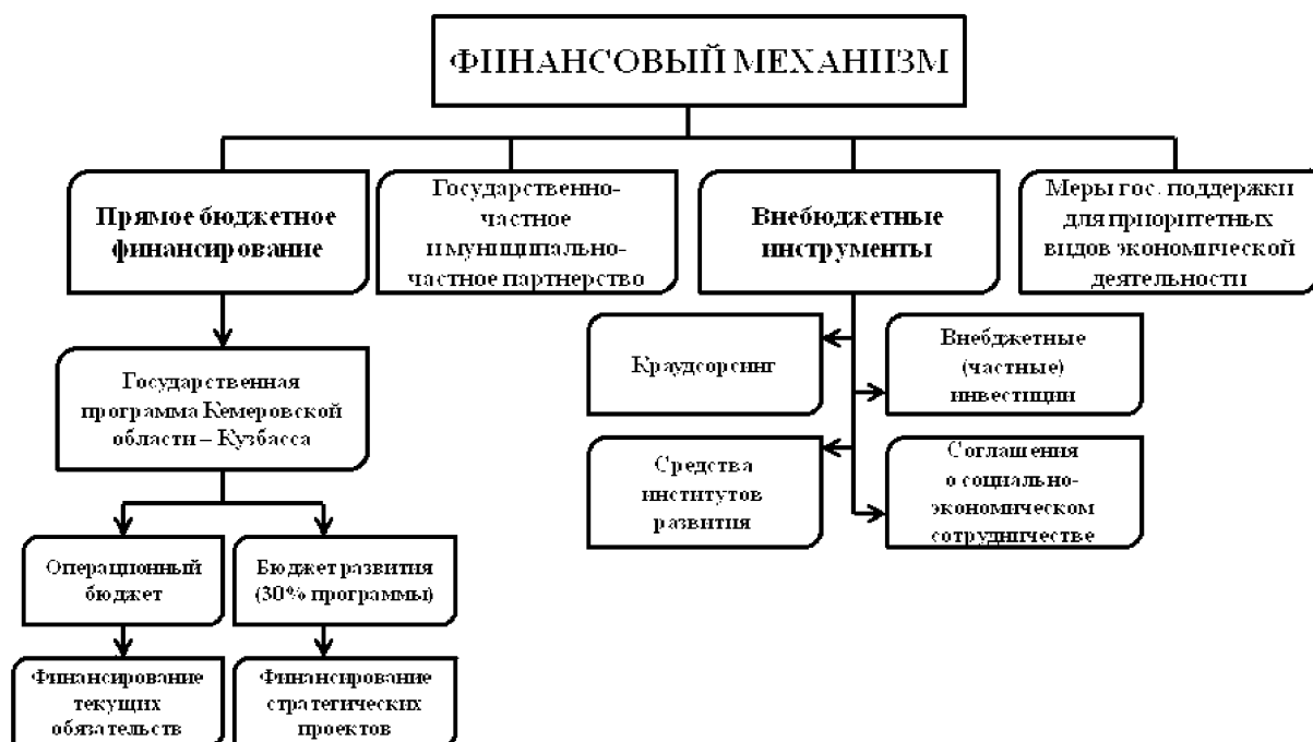
Рисунок 3. Финансовый механизм реализации Стратегии

Меры и условия предоставления государственной поддержки субъектам инвестиционной деятельности в стратегический период до 2035 г. в Кемеровской области – Кузбассе будут усовершенствованы с учетом вновь принимаемых приоритетов, задач и стратегических проектов Стратегии – 2035.