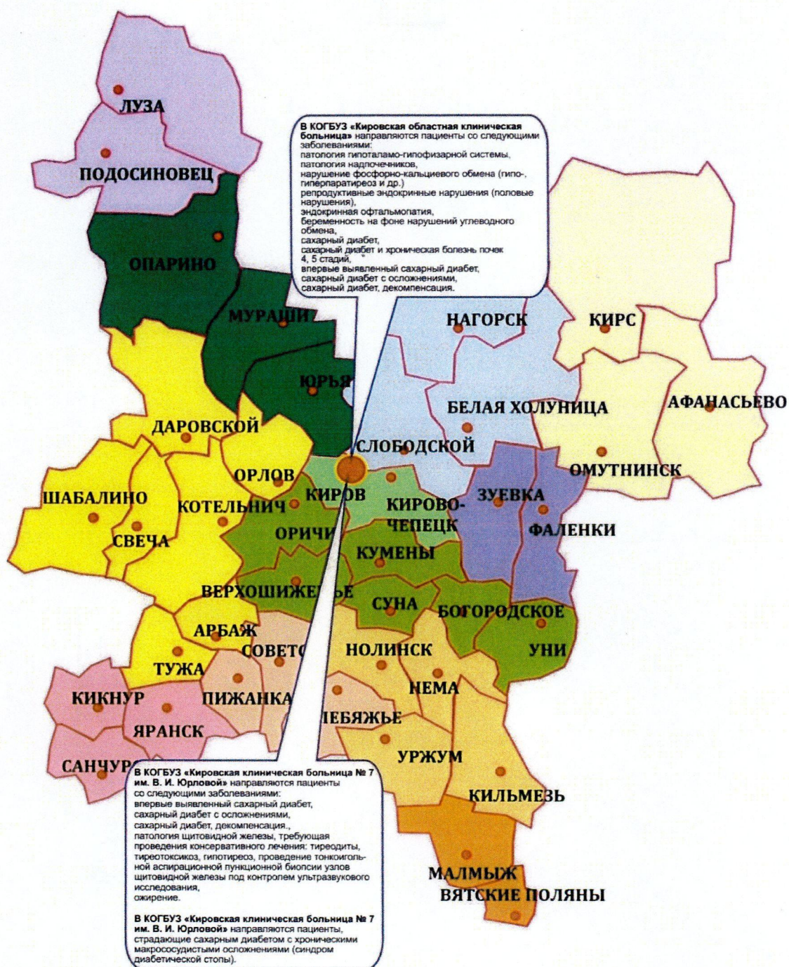
Рис. 3. Схема маршрутизации пациентов с эндокринными заболеваниями.

В Кировской области по профилю «эндокринология» для взрослого населения развернуты 105 коек круглосуточного пребывания (из них две – реанимационные) и 12 коек дневного стационара.