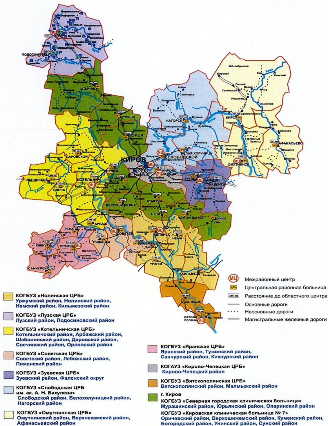
Рис. 2. Схема размещения межрайонных лечебно-диагностических центров

Перечень межрайонных лечебно-диагностических центров и наличие в них врачей-офтальмологов и врачей-хирургов представлены в таблице 20.