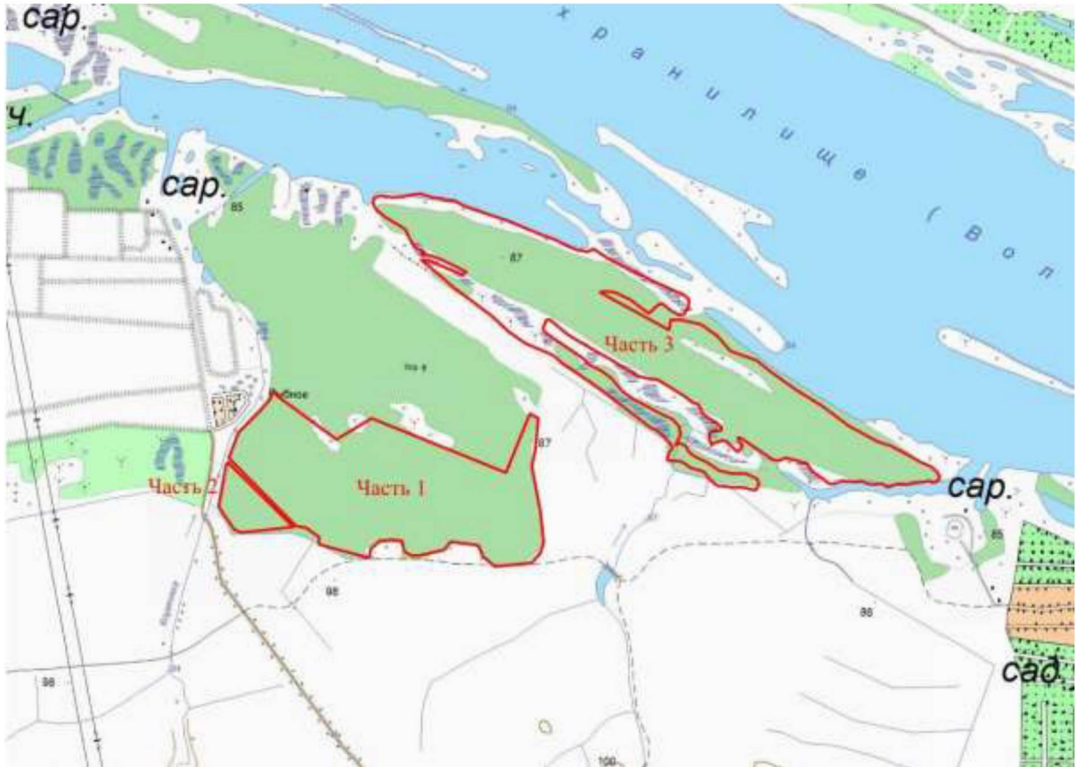
Схема границ Участка 3