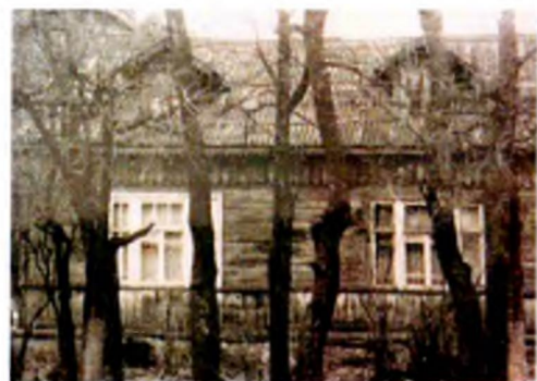
историческое фото 1989 года

заполнения оконных проемов – исторические материал исполнения (дерево), рисунок расстекловки (многочастный), единообразие цветового решения*;