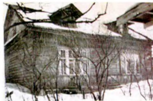
историческое фото 1988 года

оконные проемы – исторические местоположение, габариты, конфигурация (прямоугольные);