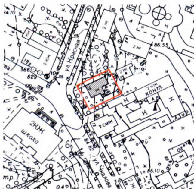
Схема характерных точек границ территории объекта культурного наследия