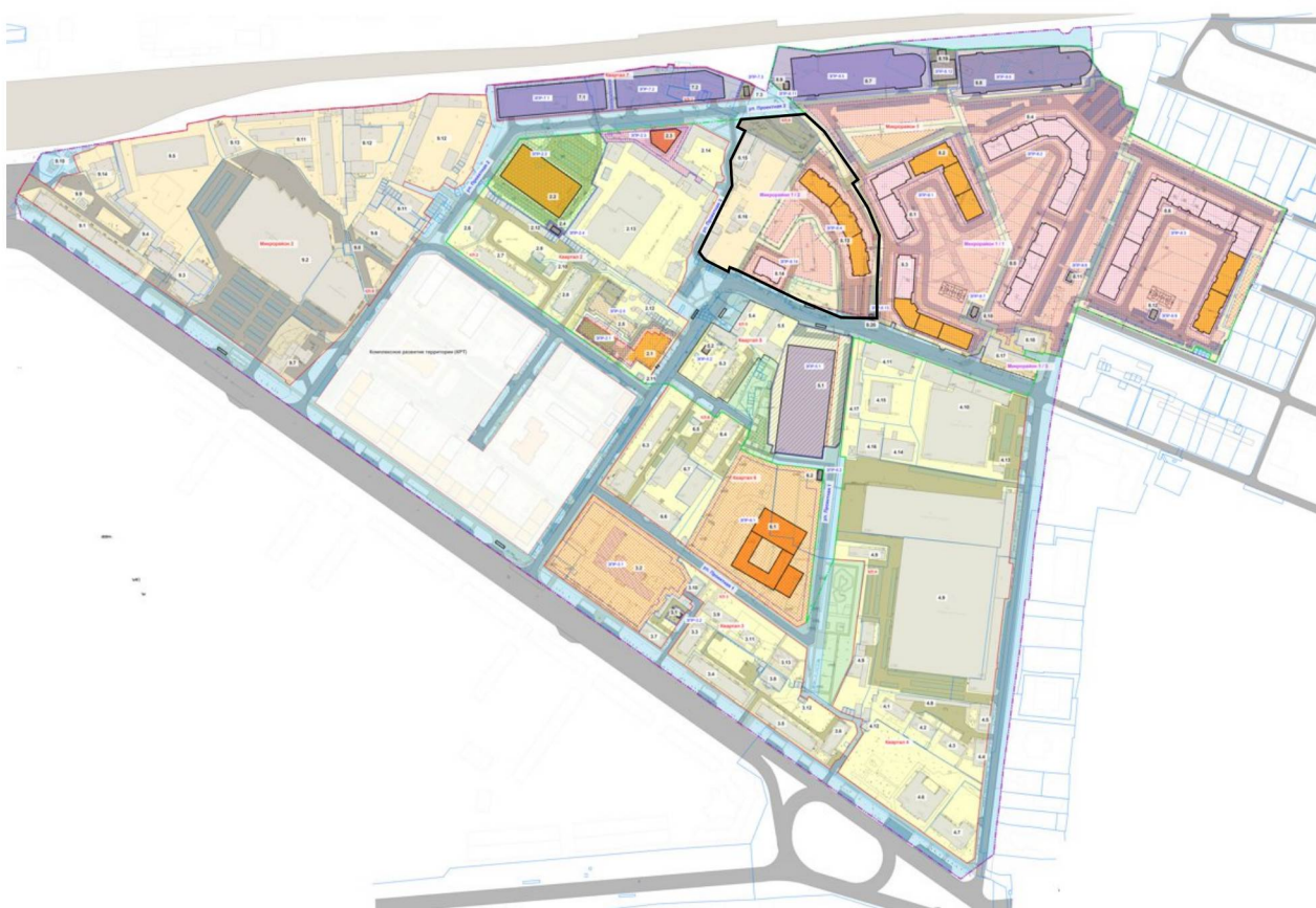
Схема границ территории проекта внесения изменений в документацию по планировке территории (проект планировки и проект межевания), ограниченной улицами Гагарина, Балмочных, Вавилова в городе Липецке, в части микрорайона 1/2

Приложение к приказу министерства строительства и архитектуры Липецкой области «О принятии решения о подготовке проекта внесения изменений в документацию по планировке территории (проект планировки и проект межевания), ограниченной улицами Гагарина, Балмочных, Вавилова в городе Липецке, в части микрорайона 1/2»