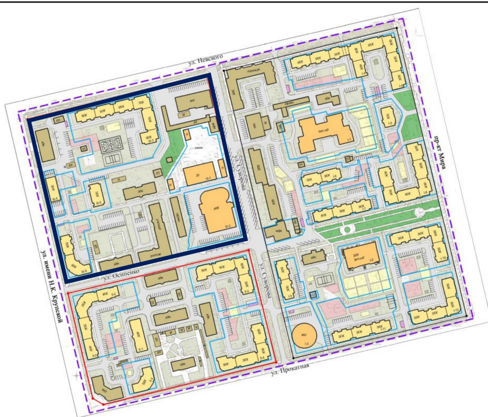
Схема границ территории проекта внесения изменений в документацию по планировке территории (проект планировки и проект межевания), ограниченной улицами Невского, Прокатной, Крупской, проспектом Мира в городе Липецке, в части квартала, ограниченного улицами Невского, Суворова, Осипенко, Имени Н.К. Крупской

к приказу министерства строительства и архитектуры Липецкой области «О принятии решения о подготовке проекта внесения изменений в документацию по планировке территории (проект планировки и проект межевания), ограниченной улицами Невского, Прокатной, Крупской, проспектом Мира в городе Липецке, в части квартала, ограниченного улицами Невского, Суворова, Осипенко, Имени Н.К. Крупской»