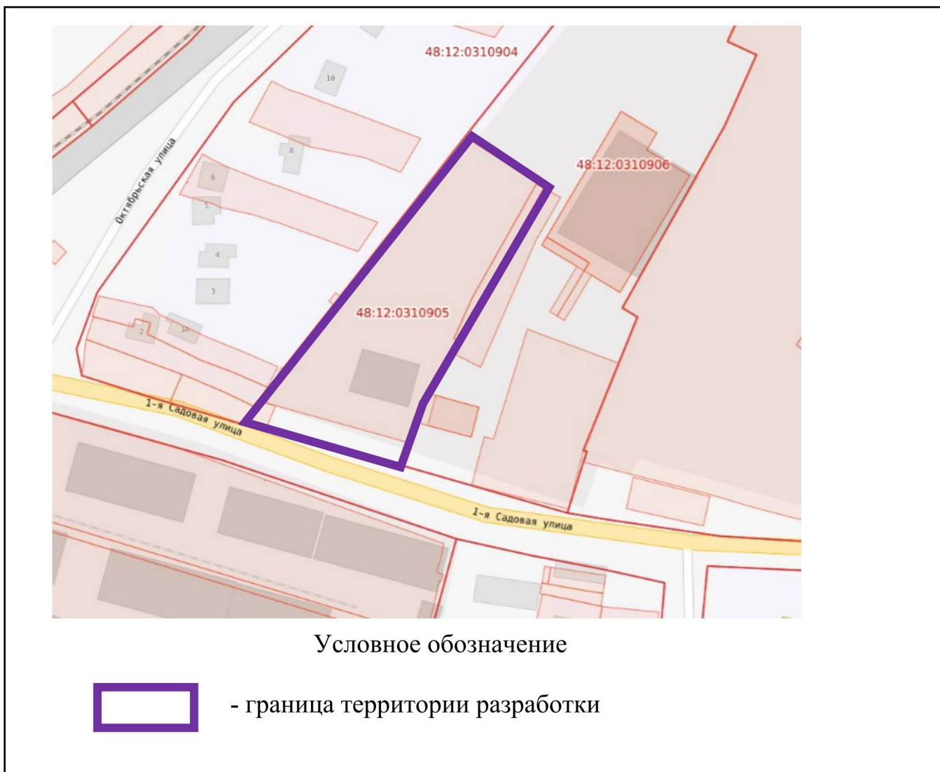
Схема границ территории для разработки документации по планировке территории (проект межевания территории в виде отдельного документа) в районе улицы Садовая в поселке Лев Толстой сельского поселения Лев-Толстовский сельсовет Лев-Толстовского муниципального района, в границах кадастрового квартала 48:12:0310905

к приказу министерства строительства и архитектуры Липецкой области «О принятии решения о подготовке документации по планировке территории (проект межевания территории в виде отдельного документа) в районе улицы Садовая в поселке Лев Толстой сельского поселения Лев-Толстовский сельсовет Лев-Толстовского муниципального района, в границах кадастрового квартала 48:12:0310905»