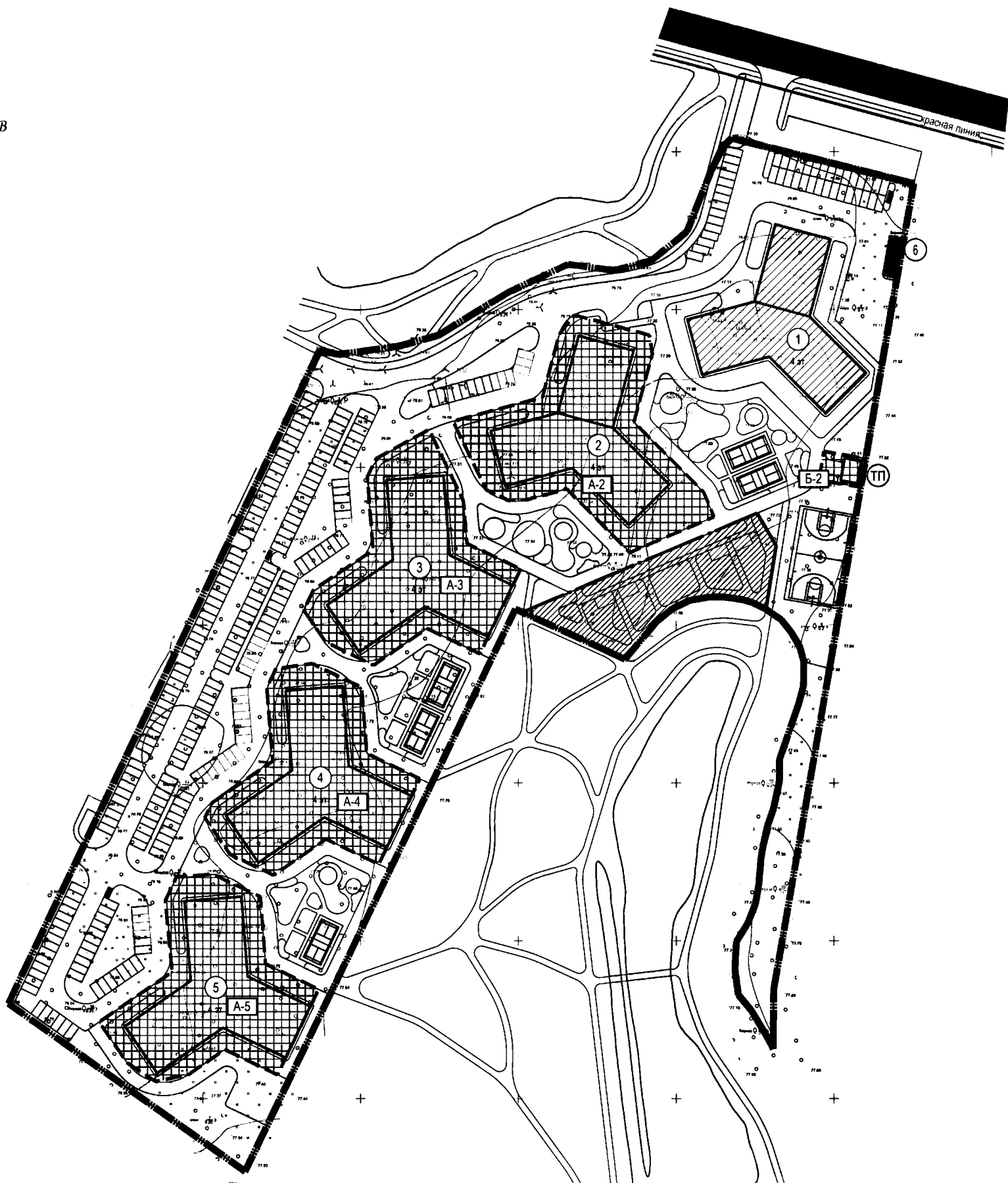
Экспликация зон планируемого размещения объектов капитального строительства

Условные обозначения существующих и планируемых элементов планировочной структуры