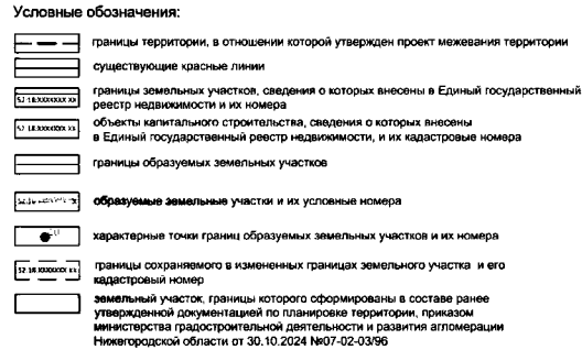
Экспликация образуемых земельных участков