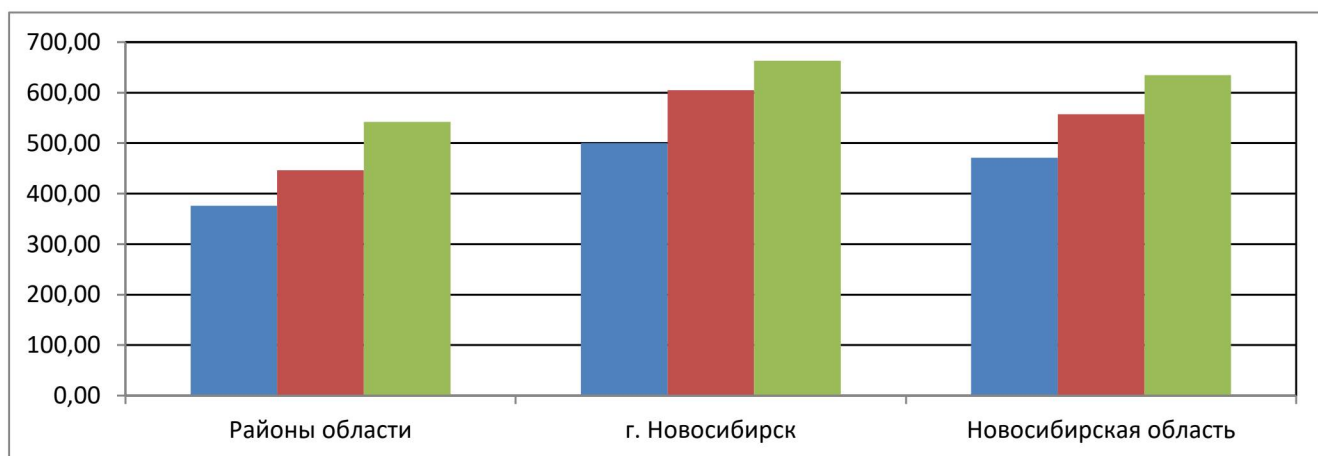
Таблица № 6