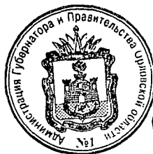
В. А. Тарасов

Временно исполняющий обязанности Губернатора Орловской области