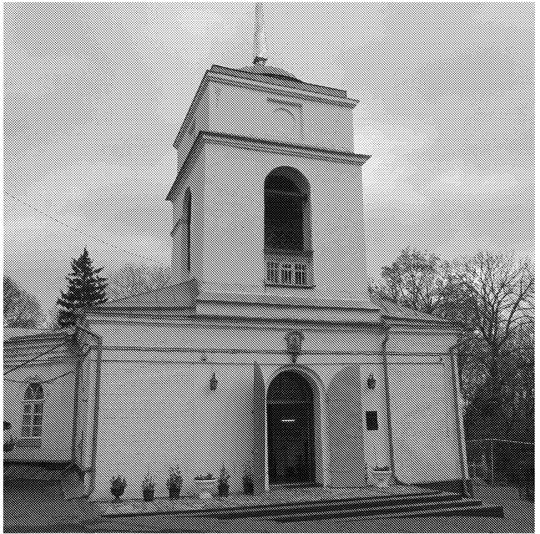
Колокольня. Входная группа главного входа.