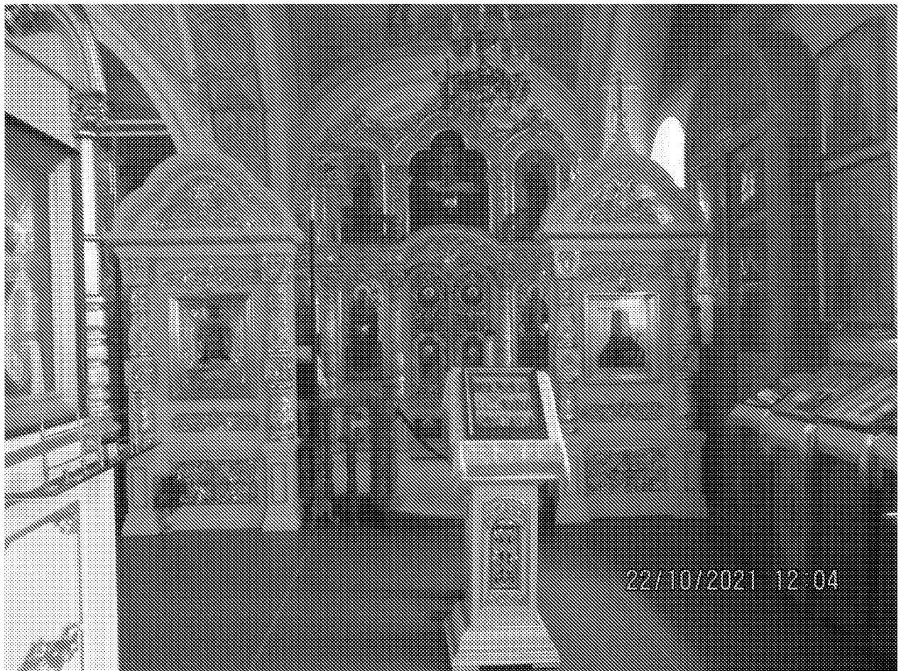
Интерьер. Правый придел храма