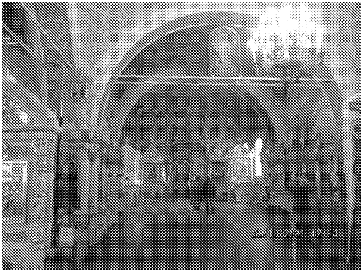
Интерьер (главный престол)