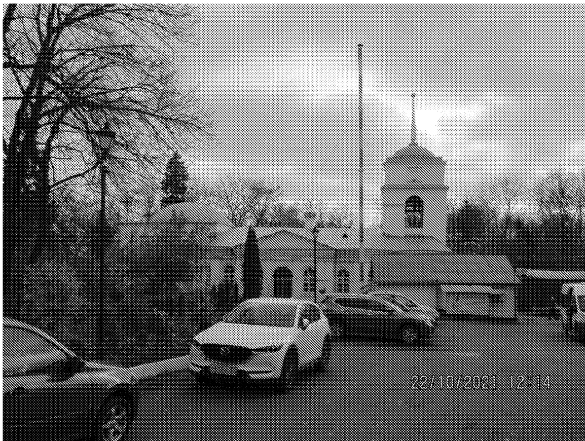
Общий вид объекта культурного наследия с северной стороны