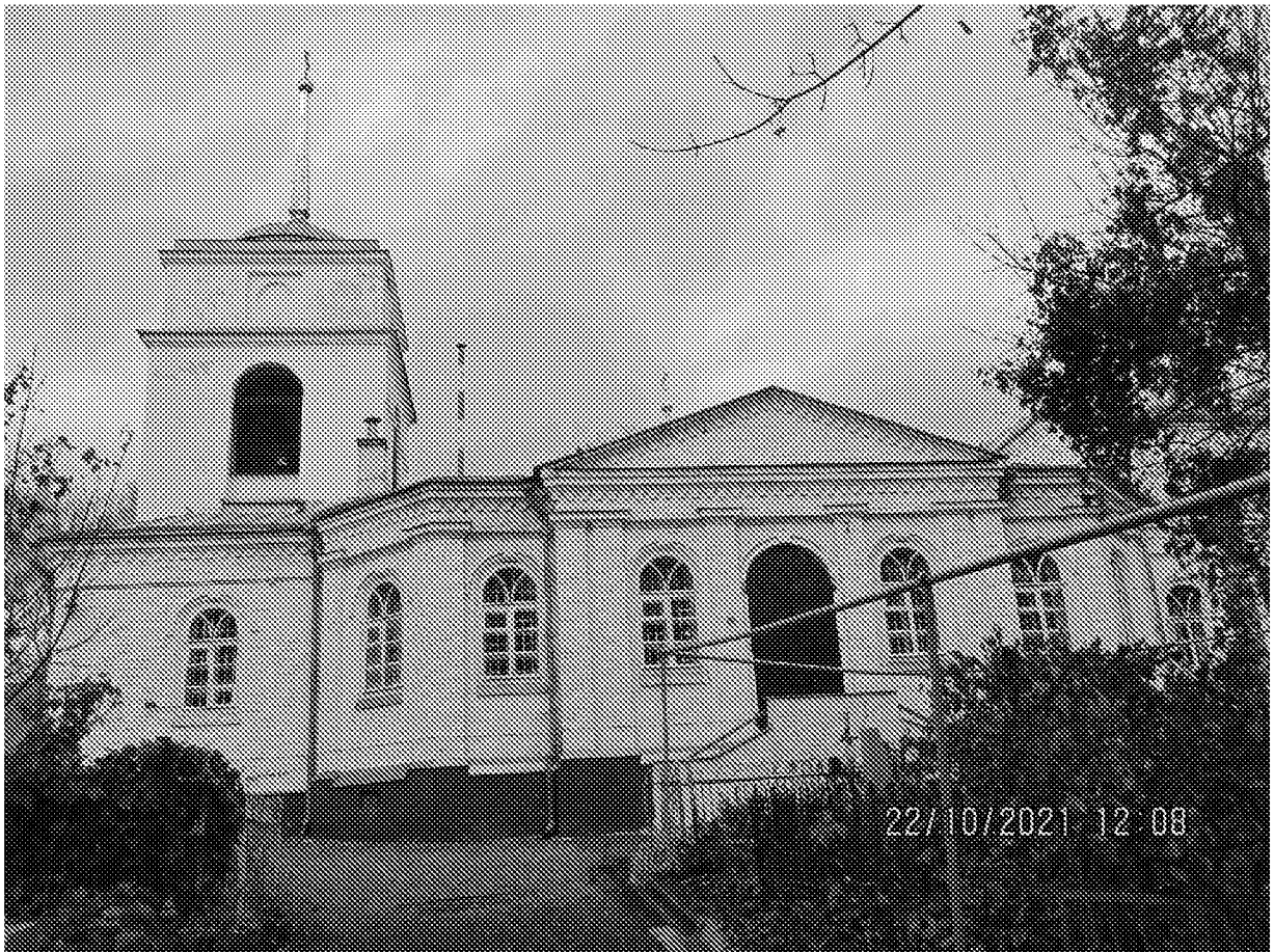
Общий вид объекта культурного наследия с южной стороны