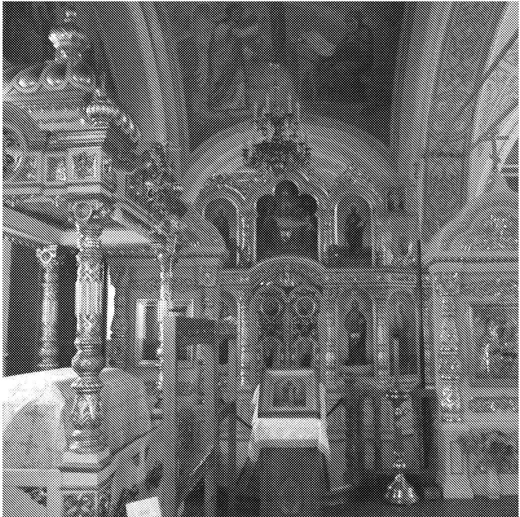
Интерьер. Левый придел храма