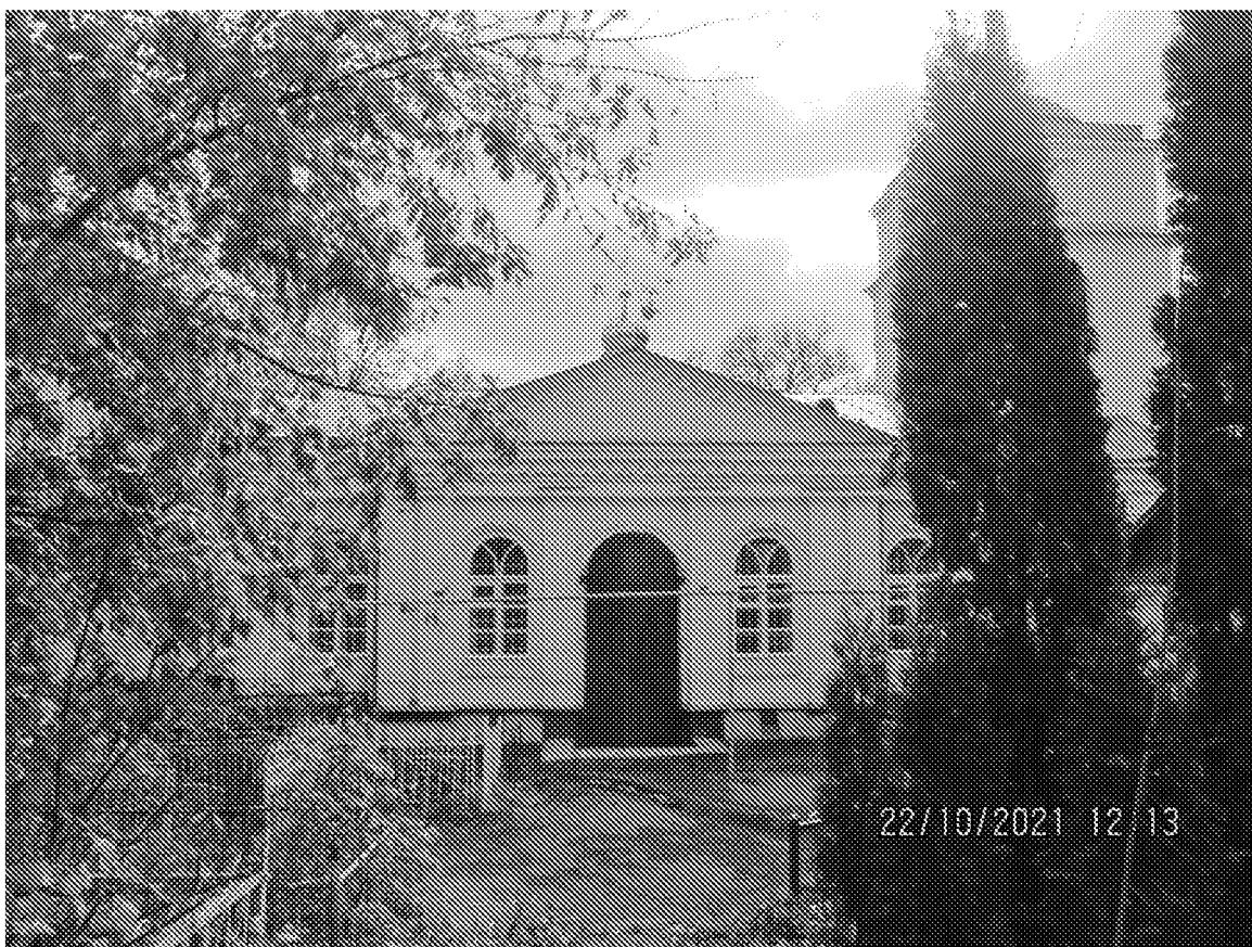
3-осевой ризалит с дверным проемом. Вид с северной стороны