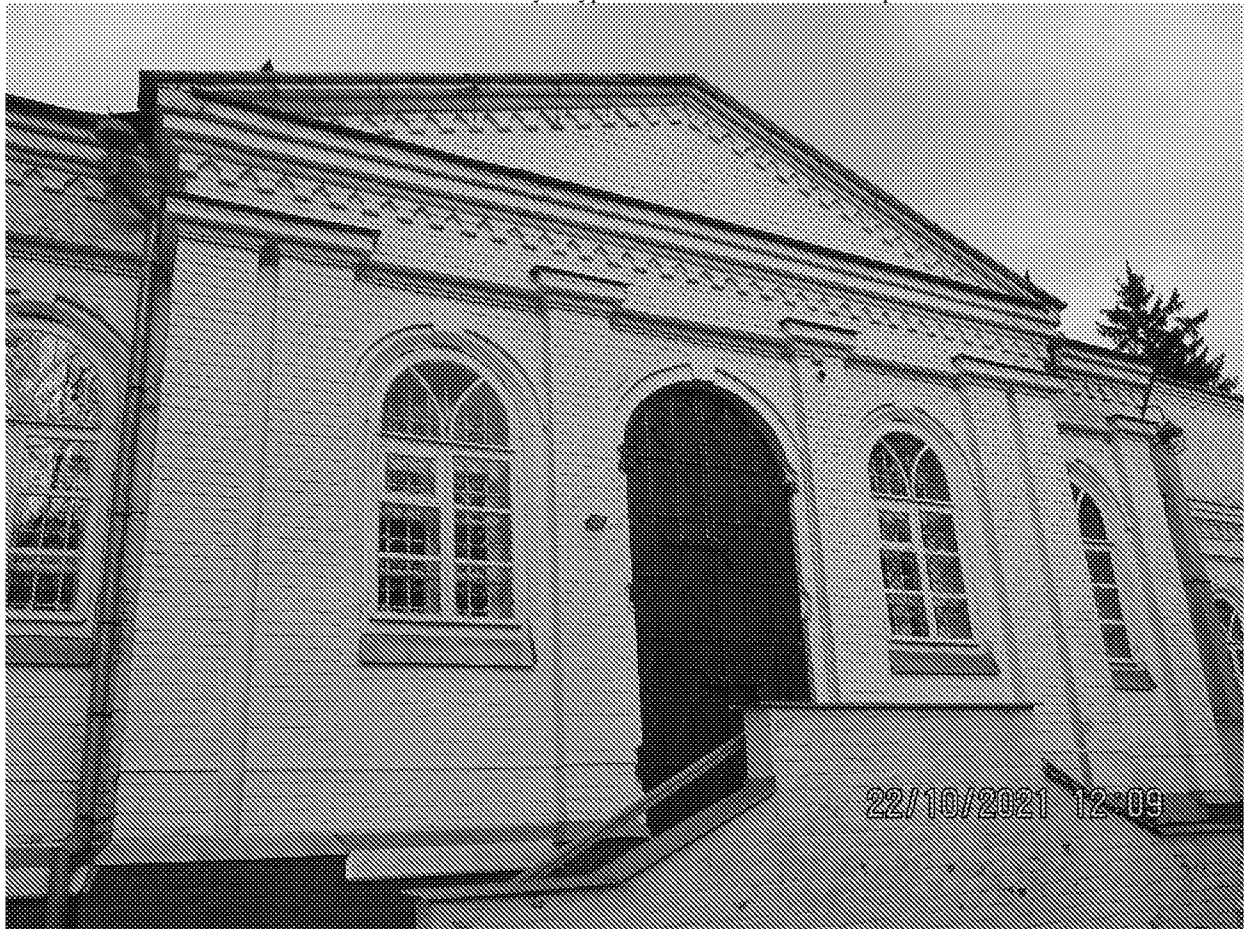
3-осевой ризалит с дверным проемом, двухвходное крыльцо. Вид с южной стороны