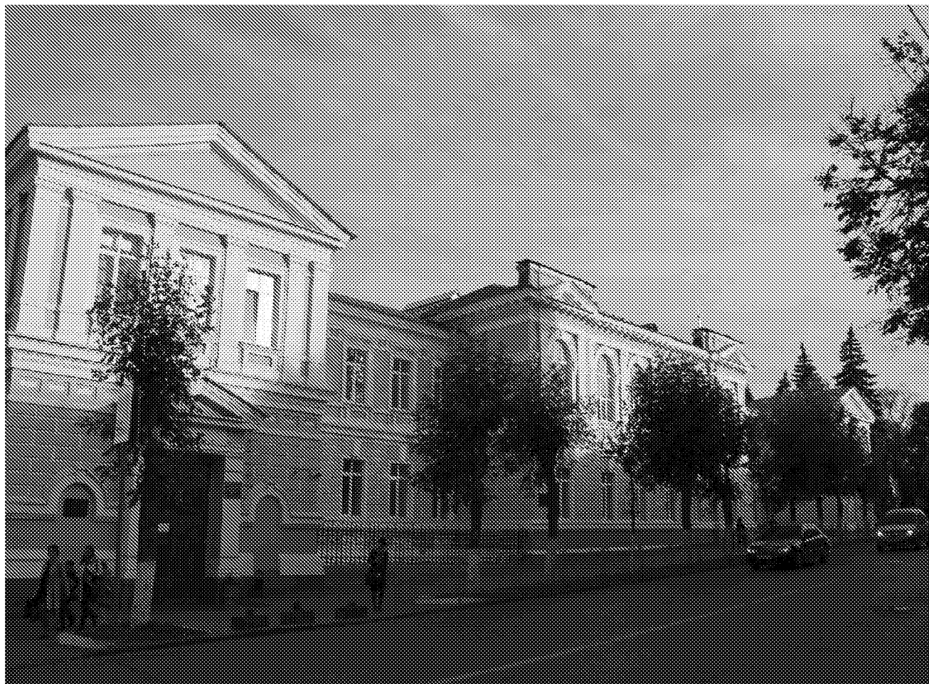
Общий вид объекта культурного наследия (главный фасад, выходящий на ул. Володарского)