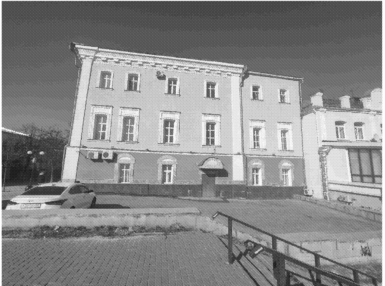
Фрагмент южного фасада объекта культурного наследия