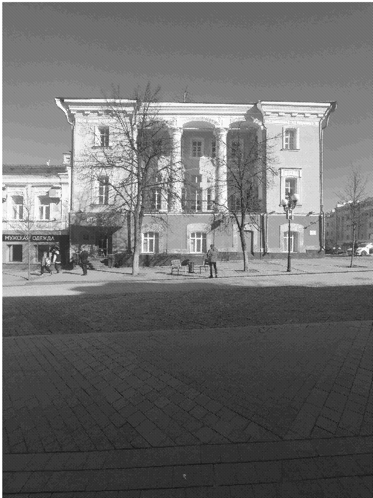
Вид на главный фасад объекта культурного наследия