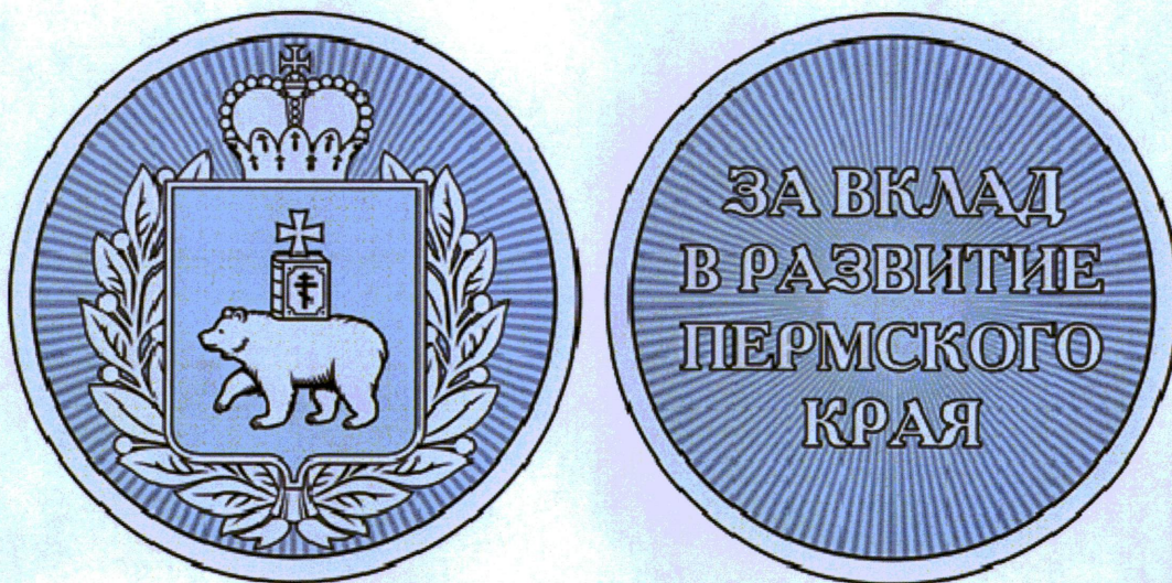
Рисунок памятного знака «За вклад в развитие Пермского края»