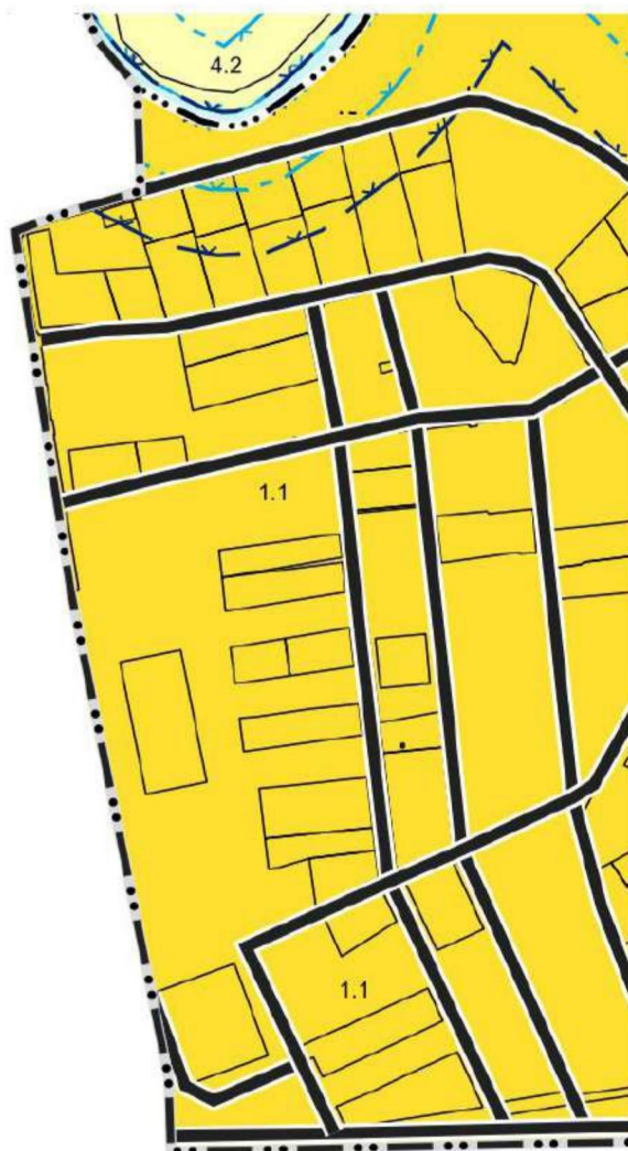
Фрагмент карты градостроительного зонирования Масштаб 1:6000

Границы единиц административно-территориального деления Российской Федерации