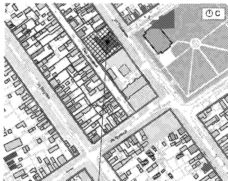
Объект культурного наследия регионального значения "Второе женское пригородное училище", расположенный по адресу: г. Сыктывкар, ул. Плеханова, 48

Границы территории объекта культурного наследия регионального значения "Второе женское пригородное училище."