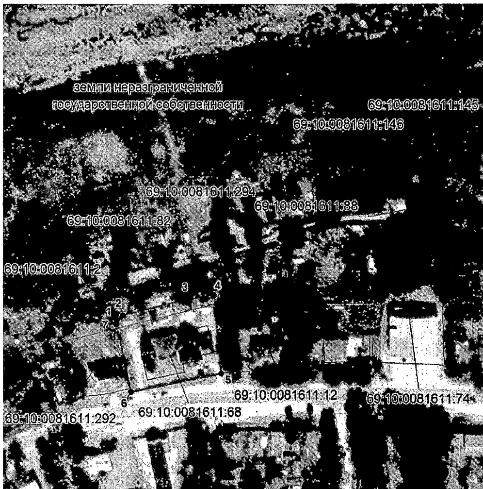
Схема границ территории объекта культурного наследия федерального значения «Казанская церковь», 1764 г., расположенного по адресу: Тверская область, Калининский район, село Медное, улица Советская, дом 124.