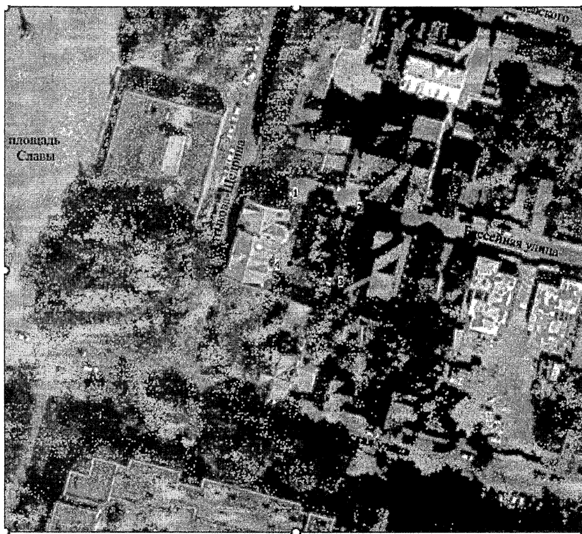
Схема границ территории объекта культурного наследия регионального значения «Дом жилой, сер. XIX в.», расположенного по адресу: Тверская область, город Тверь, улица Бассейная, дом 4