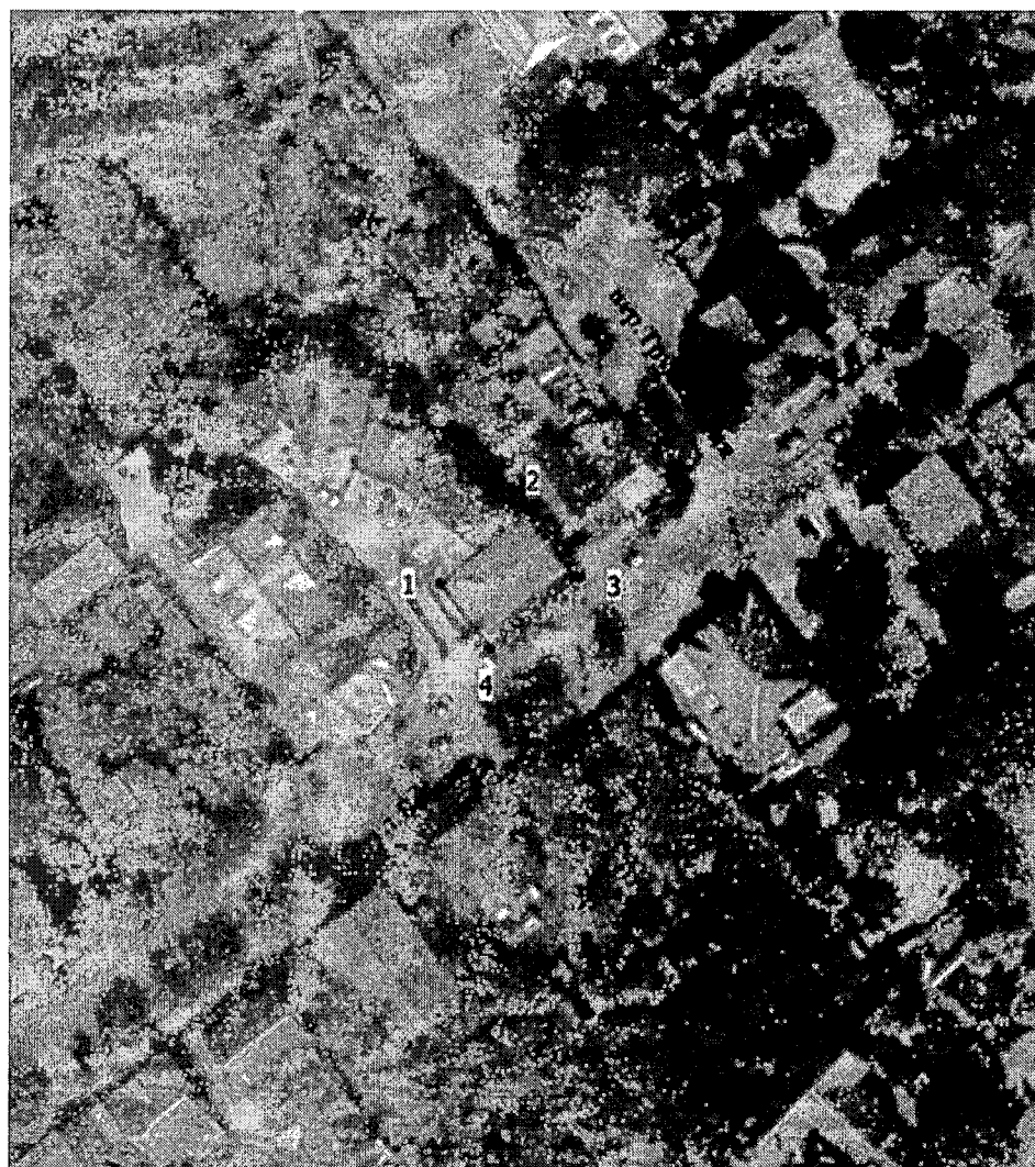
Схема границ территории объекта культурного наследия регионального значения «Дом жилой, кон. XIX в.», расположенного по адресу: Тверская область, город Тверь, улица Бебеля, дом 42а