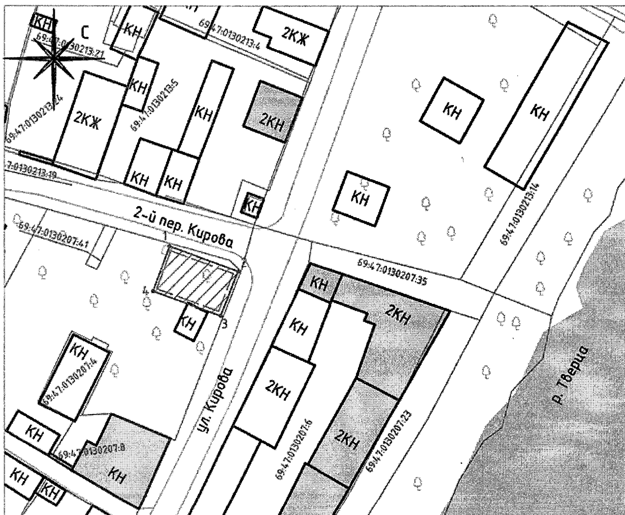
Схема границ территории объекта культурного наследия федерального значения «Жилой дом», середина XVIII в., расположенного по адресу: Тверская область, город Торжок, 2-ой переулочек Кирова, дом 4