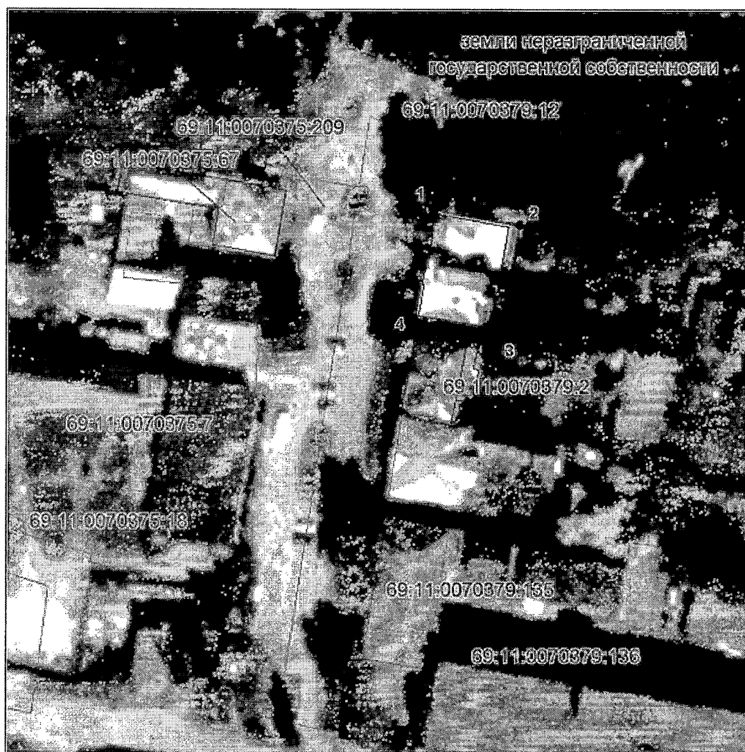
Схема границ территории объекта культурного наследия федерального значения «Образец жилой застройки улицы», конец XVIII - начало XIX вв., расположенного по адресу: Тверская область, Калязинский муниципальный округ, город Калязин, площадь Преподобного Макария Калязинского, дом 1 (ранее по нормативному документу улица Карла Маркса)