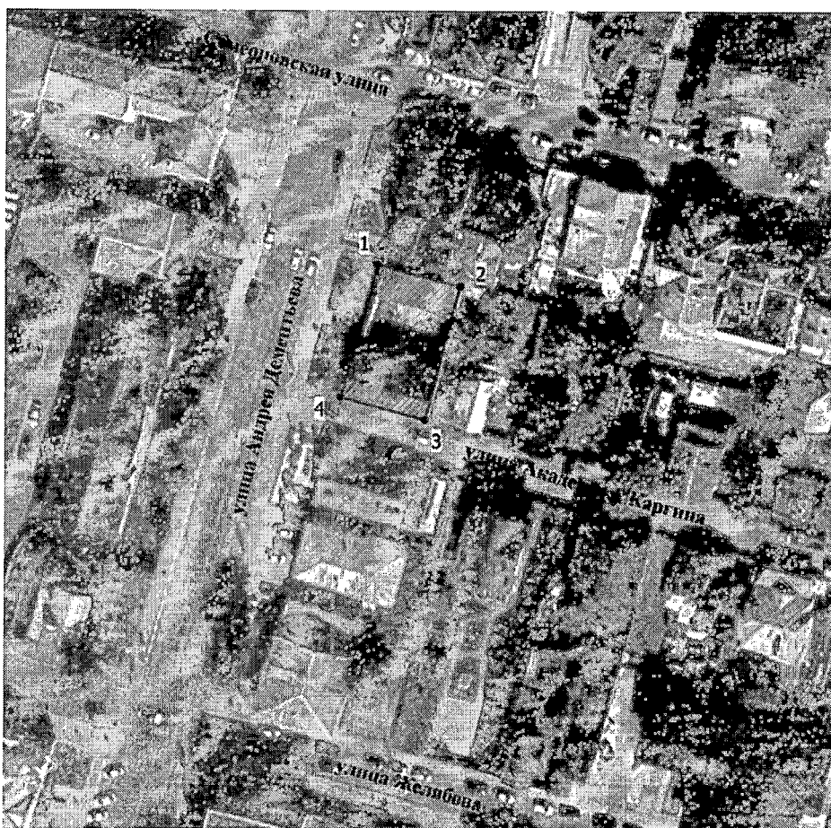
Схема границ территории объекта культурного наследия регионального значения (ансамбля) «Усадьба городская», нач. XIX в., 2-ая пол. XIX в., включающего: «Главный дом», нач. XIX в., 2-я пол. XIX в., «Флигель», 2-я пол. XIX в., «Ворота проездные», 2-я пол. XIX в., расположенного по адресу: Тверская область, город Тверь, улица Андрея Дементьева, дом 20/1 (ранее по нормативному документу улица Володарского)