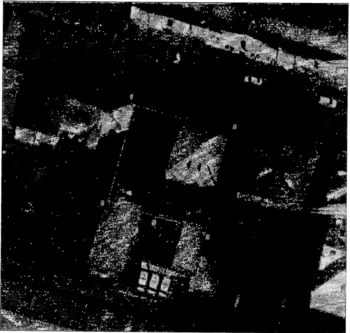
Схема границ территории объекта культурного наследия регионального значения «Дом Сапунова», кон. XVIII в., сер. XIX в., расположенного по адресу: Тверская область, город Тверь, улица Крылова, дом 26