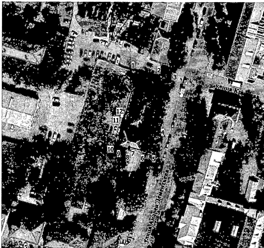
Схема границ территории объекта культурного наследия регионального значения (ансамбля) «Усадьба городская», нач. XIX в., 2-ая пол. XIX в., включающего: «Главный дом», 1-ая пол. XIX в., «Флигель», нач. XIX - 2-я пол. XIX вв., «Ворота проездные», сер. XIX в., «Надворные хозяйственные строения на погребях», XIX в., расположенного по адресу: Тверская область, город Тверь, улица Андрея Дементьева, дом 27, дом 29 (ранее по нормативному документу улица Володарского)