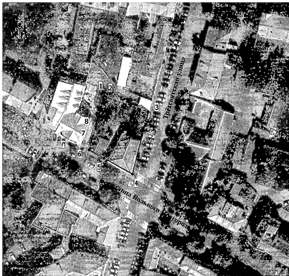
Схема границ территории объекта культурного наследия регионального значения (ансамбля) «Усадьба городская», кон. XVIII в. - 2-ая четв. XIX в., 2-ая пол. XIX в., включающего: «Главный дом», 2-ая пол. XVIII в. - XIX в., «Флигель жилой», 2-ая четв. XIX в., «Ворота проездные с калиткой», сер. XIX в., «Хозяйственное надворное строение», сер. XIX в., «Ограда», 2-ая четв. XIX в., расположенного по адресу: Тверская область, город Тверь, улица Вольного Новгорода, дом 5