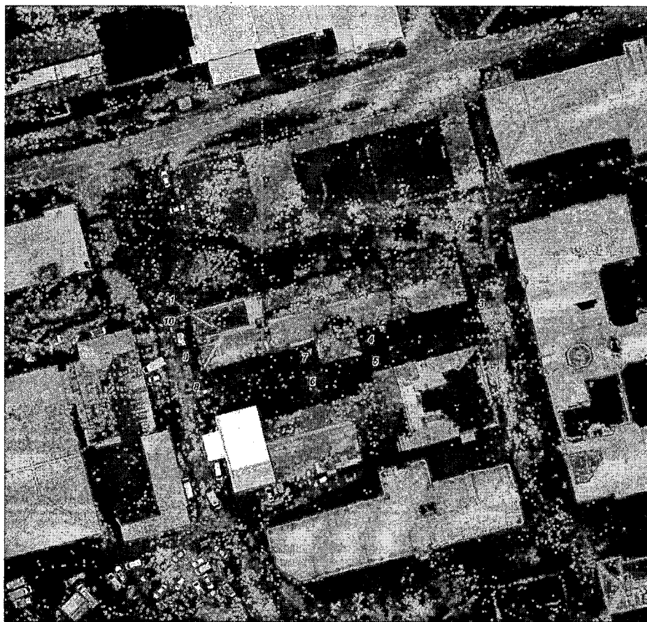
Схема границ территории объекта культурного наследия регионального значения «Здание казармы для рабочих Товарищества Тверской мануфактуры», 1893 г., расположенного по адресу: Тверская область, г. Тверь, территория Двор Пролетарки, дом 17