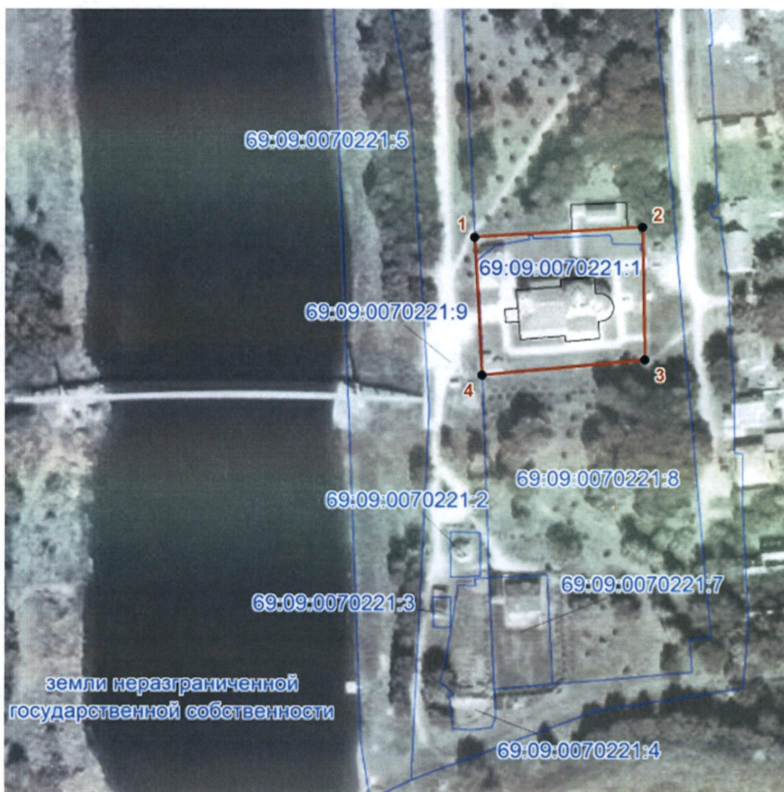
Схема границ территории объекта культурного наследия федерального значения «Успенский собор», 1801 г., расположенного по адресу: Тверская область, Зубцовский муниципальный округ, город Зубцов, улица Садово-Набережная, дом 1а