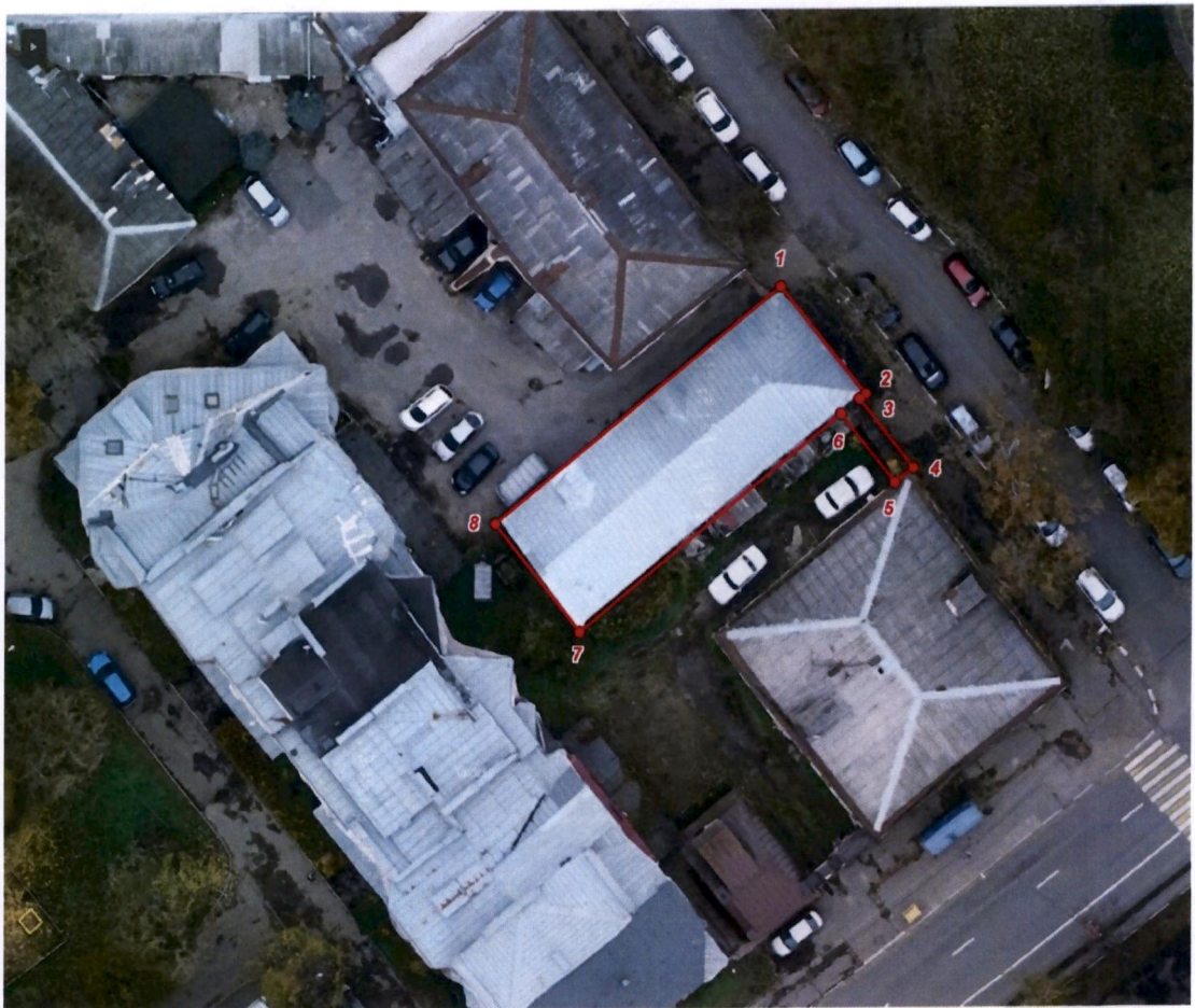
Схема границ территории объекта культурного наследия регионального значения (ансамбля) «Комплекс застройки набережной», кон. XVIII в., нач. XIX – нач. XX вв., и объектов, входящих в его состав, расположенных по адресу: Тверская область, город Тверь, Набережная реки Тьмаки, дом 31