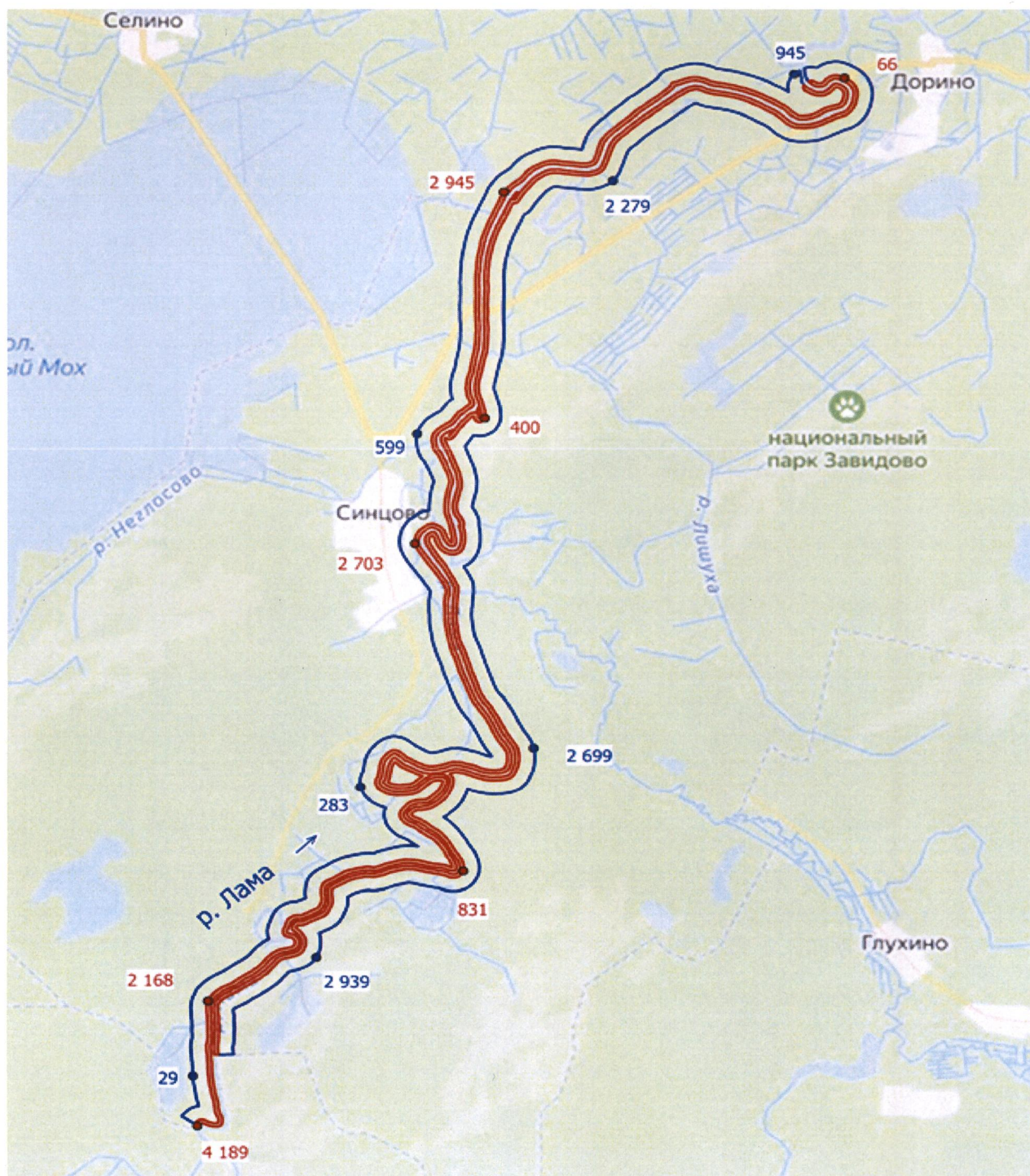
Схема местоположения границ водоохранной зоны и прибрежной защитной полосы реки Лама, расположенной в Конаковском и Калининском районах Тверской области