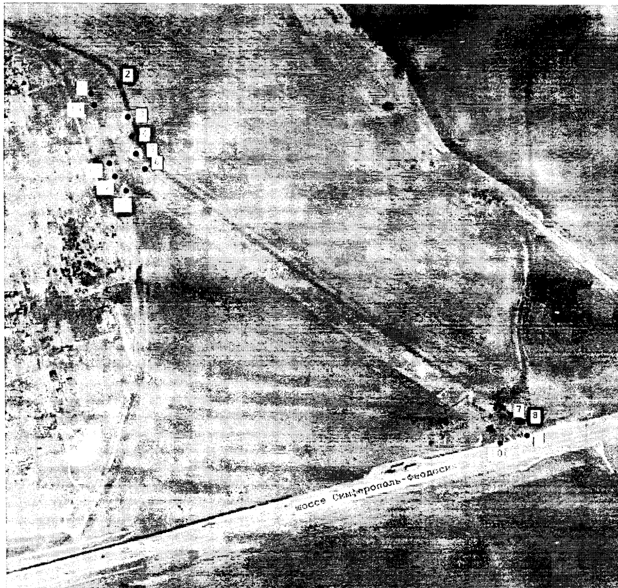
Схема границ территории М 1:3000