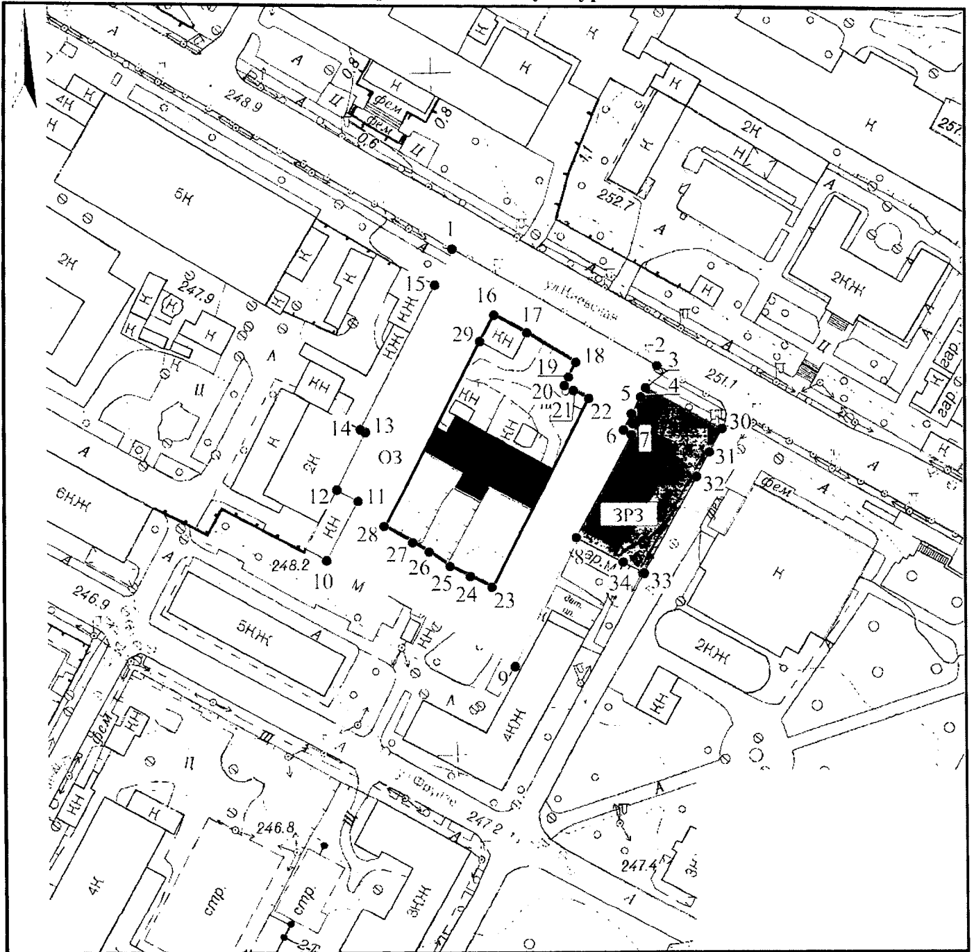
Схема зон охраны объекта культурного наследия